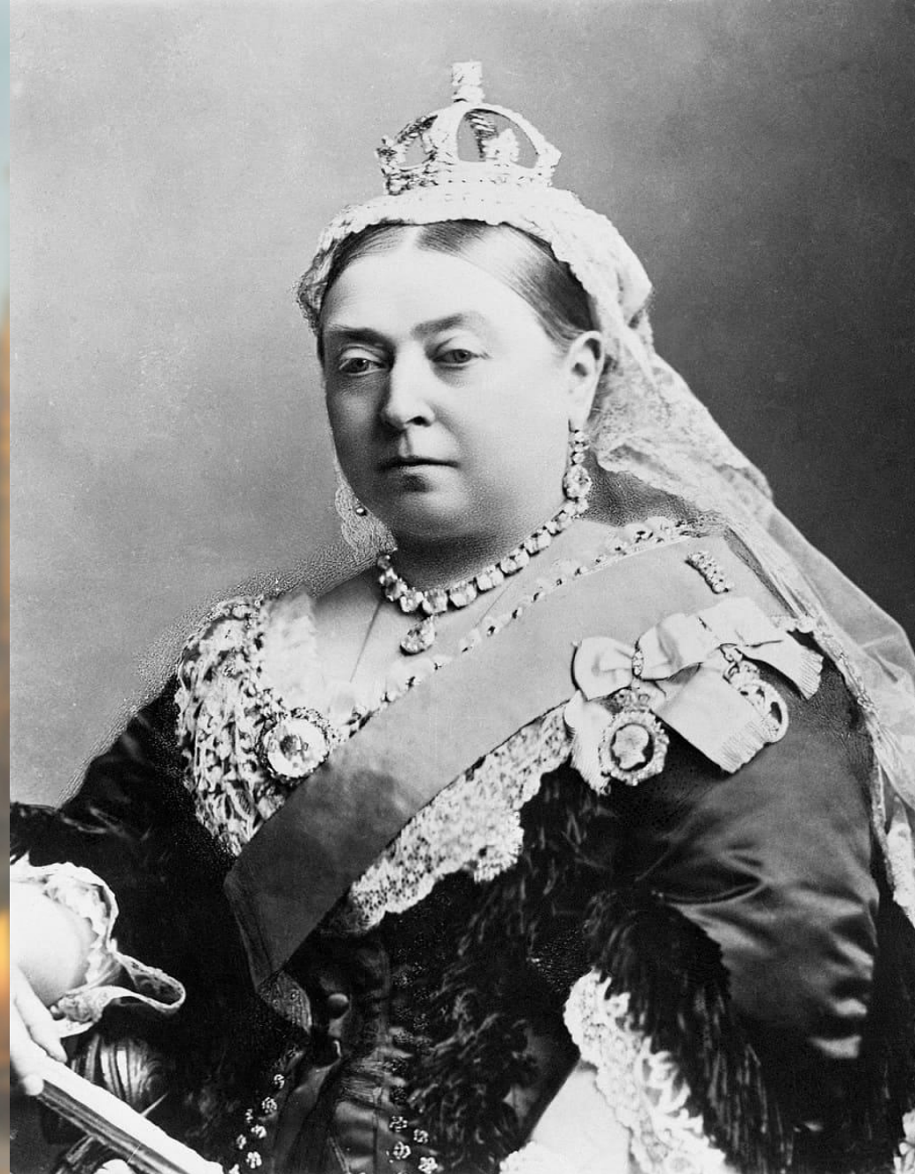
Королева Виктория (1837 – 1901)