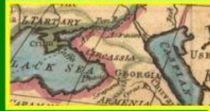
КАРТА ЕВРОПЫ. ГОСУДАРСТВО ЧЕРКЕСИЯ 17 ВЕК

УБЫКИ ЧАМГУИ БЖЕДУГИ АБАДЗЕКИ КАБАРДЖИЦЫ ШАПСУГИ МАТЪУКАИ ЖАНЕИ АДЖЕИ БЕСЛЕМЕН НАТУКАИ МАХТАИИ