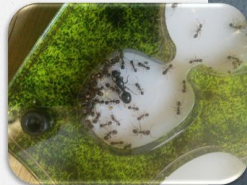
Мирмичинов — хранитель муравьев