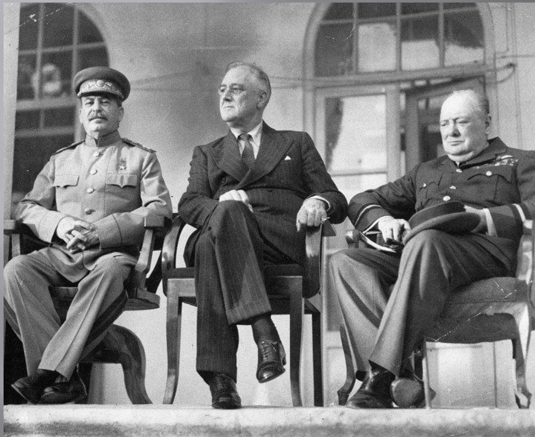
Слева на право: И.В.Сталин, Ф. Д.Рузвельт, У.Черчилль