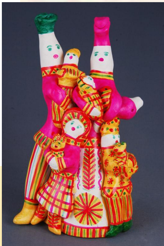
ФИЛИМОНОВСКАЯ ИГРУШКА (ДЕРЕВНЯ ФИЛИМОНОВО)