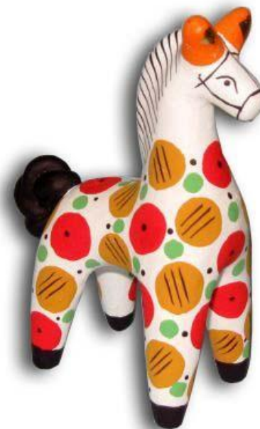
Дымковская игрушка (слобода Дымково)