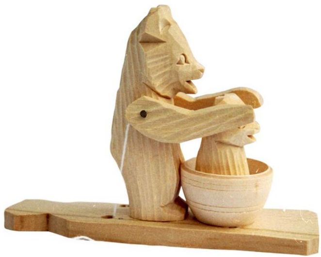
Богородская игрушка (село Богородское)