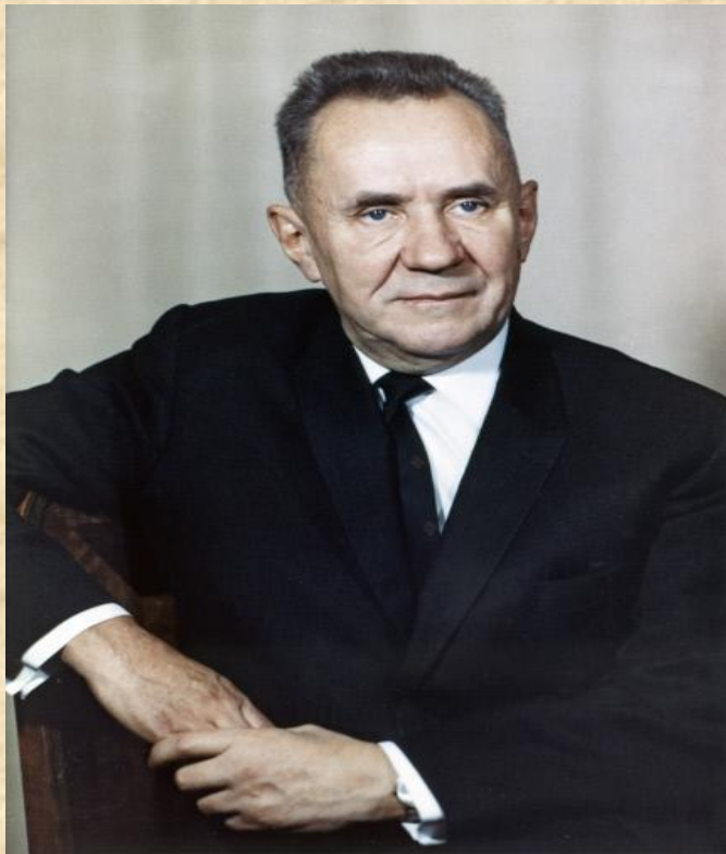
Косыгин Алексей Николаевич Председатель Совета Министров (1964—1980 гг.)

Цель: стимулировать материальный интерес, который бы привел к повышению общественного производства.