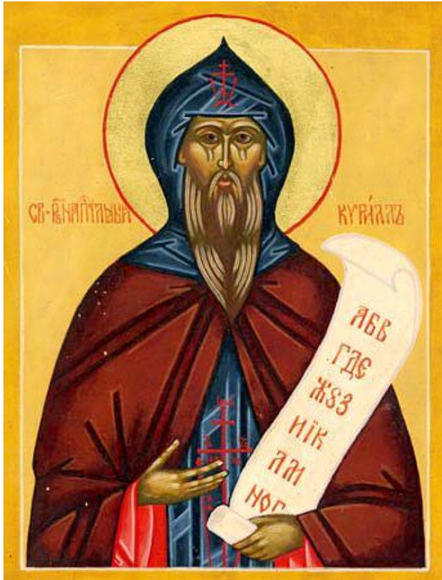
Святой равноапостольный Кирилл (827 – 869), по прозвищу Философ, учитель Словенский

Константин (в миру) получил блестящее образование при императорском дворе в столице Византии – Константинополе. Быстро изучил грамматику, арифметику, геометрию, астрономию, музыку, знал 22 языка. Интерес к наукам, упорство в учении, трудолюбие – всё это сделало его одним из самых образованных людей Византии. Не случайно его за великую мудрость прозвали Философом.