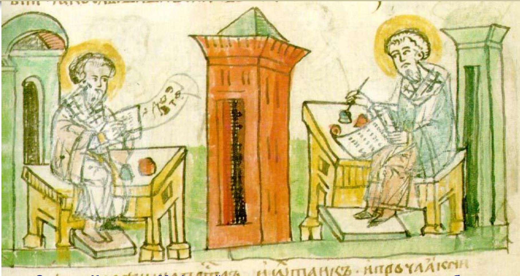
Святые Кирилл и Мефодий создают церковнославянскую азбуку. Миниатюра Радзивилловской летописи. XV в.