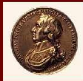
Монета с изображением Кромвеля