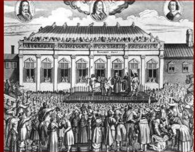
Казнь Карла I

Май 1649г. - Англия объявлена республикой. Был создан исполнительный орган Государственный совет во главе с Кромвелем