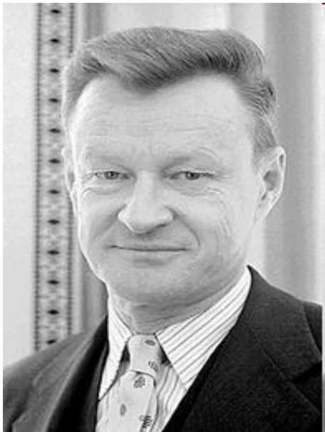
Карл Иоахим Фридрих