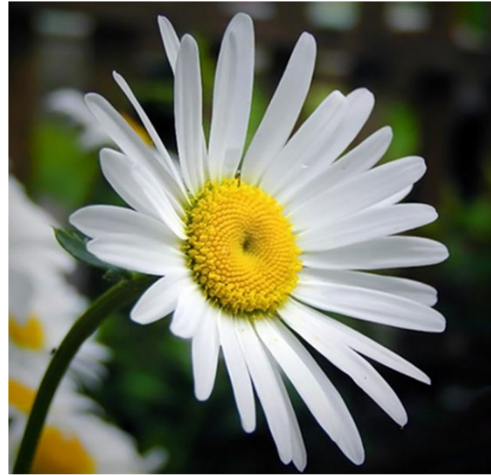
chamomile /'kæməmaɪl/ ромашка 🗣️