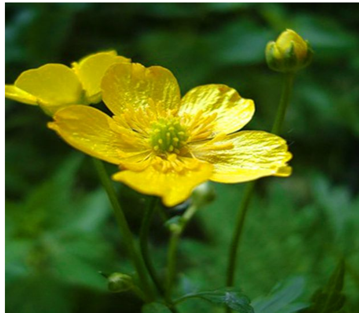
Buttercup 📣 /'bʌtəkʌp / лютик