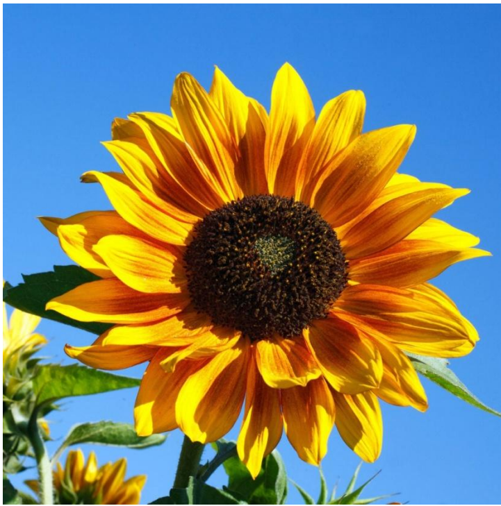
sunflower / 'sʌn,flaʊə / подсолнух 🗣️