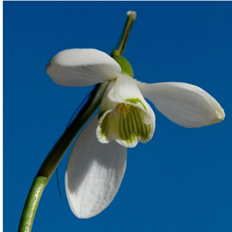
snowdrop /'snəʊdrɔ:p/ подснежник 🗣️