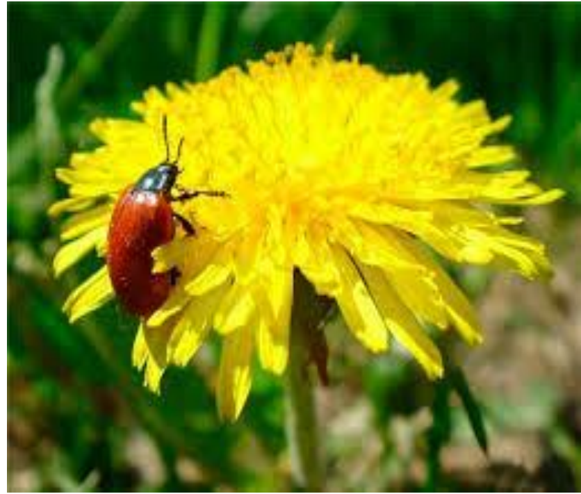
Dandelion /'dændɪlaɪən/ одуванчик 🗣️