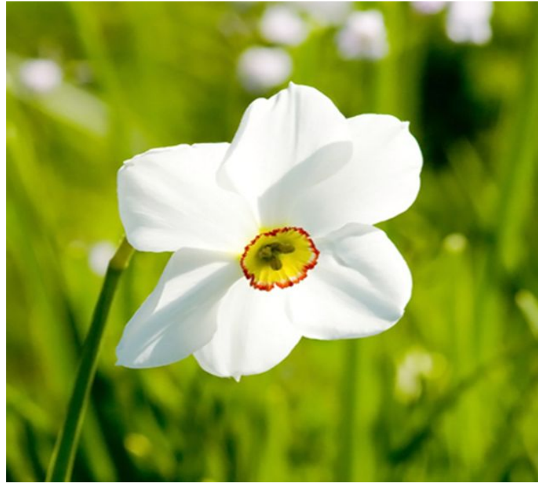
narcissus / nɑ:'sɪsəs / нарцисс 🗣️