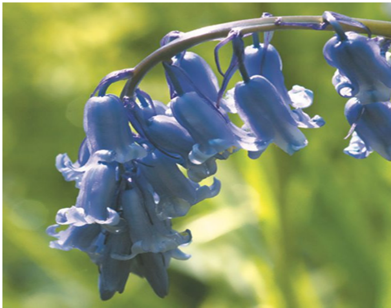
bluebell/ 'blu:bel / колокольчик 📣