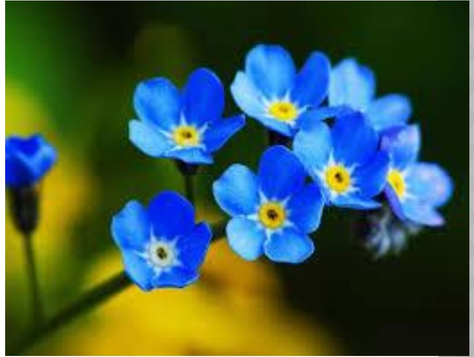
forget-me-not 📣 /fə'getmɪnət / незабудка