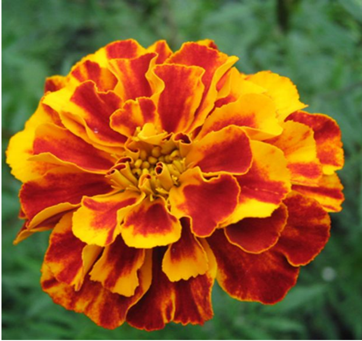
marigold / 'mæɪrɪgəʊld / бархатцы 🗣️