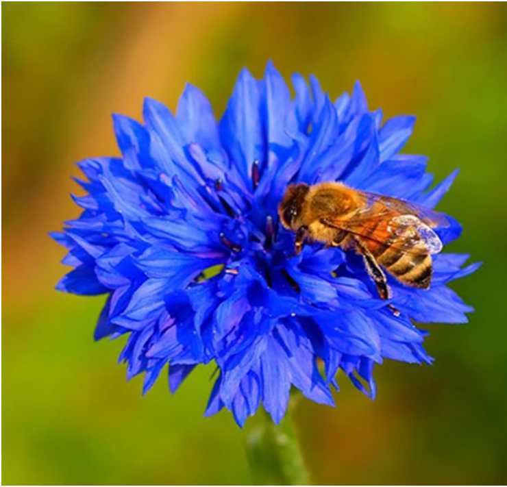
cornflower /'kɔ:nflaʊə/ василёк 🗣️