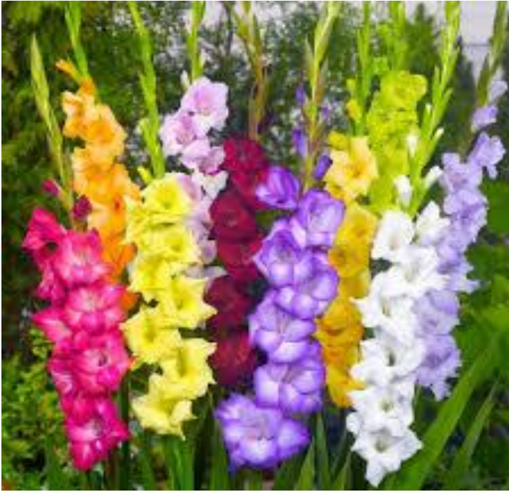
gladiolus /,glædɪ'əʊləs/ гладиолус 📣