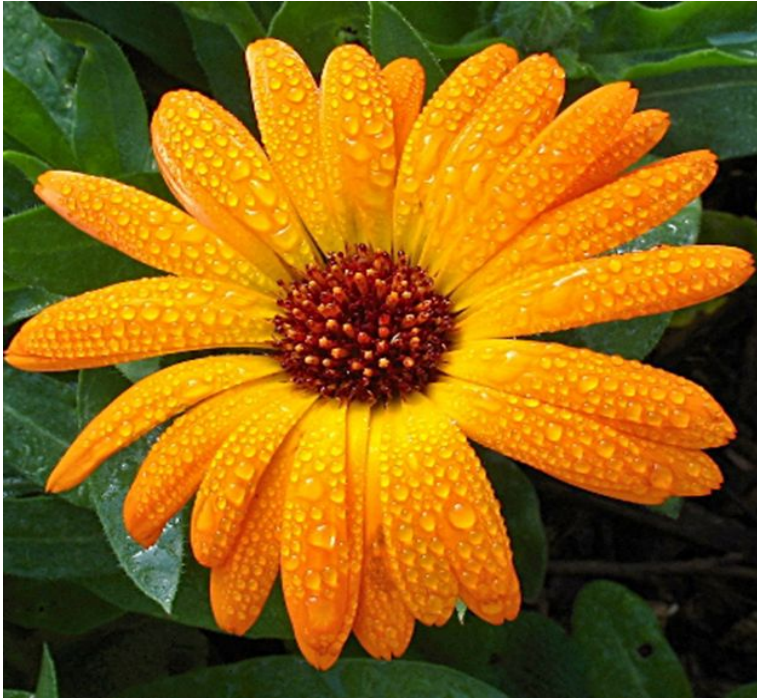
calendula /kæ'leɪndʒʊlə/ календула 🗣️