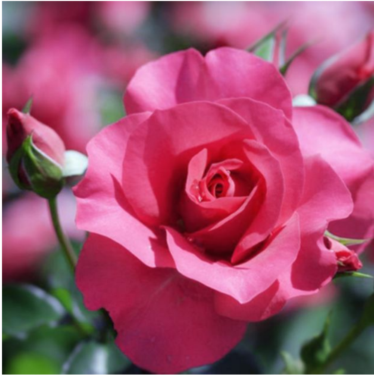
rose /rəʊz/роза 🗣️