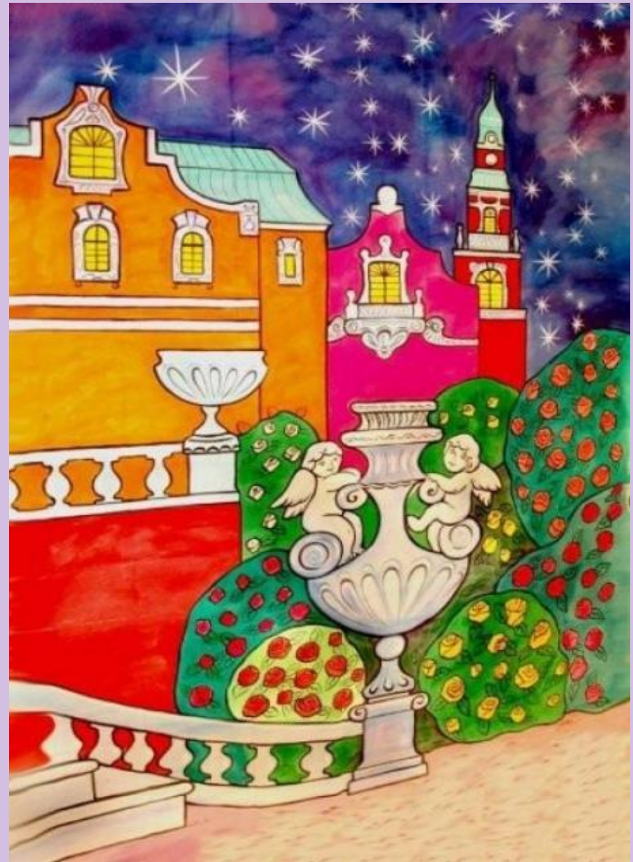
Задник спектакля «Золушка»