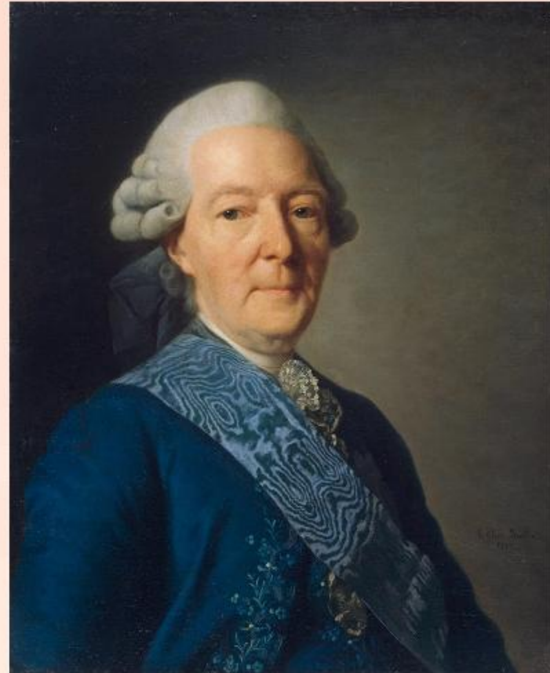
Портрет Ивана Ивановича Бецкого работы Александра Рослина