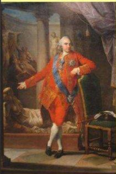
Портрет Кирилла Григорьевича Разумовского. Худ. Г.П. Батони.

В 1764 г. Екатерина приняла отставку последнего гетмана Украины К.Г. Разумовского.