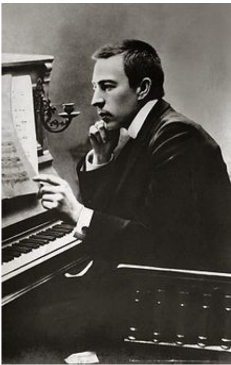
Рахманинов, Сергей Васильевич