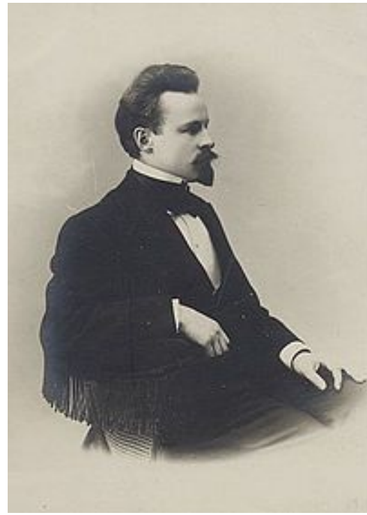
Бальмонт, Константин Дмитриевич