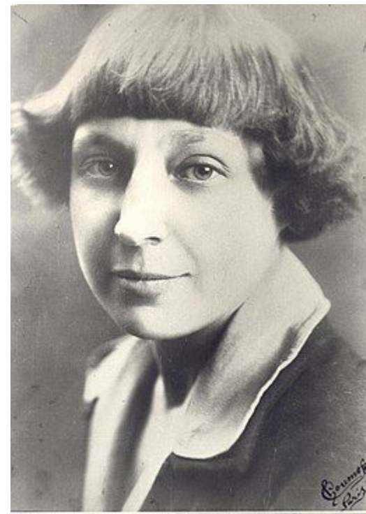
Цветаева, Марина Ивановна