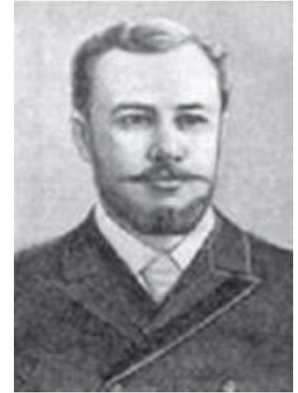
В.И. Менделеев русский инженер

Связь между полуостровом Тамань и полуостровом Керчь, и выполнение как транспортных, так и иных функций.