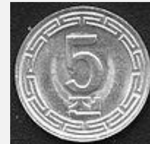
5 чонов 1974 года