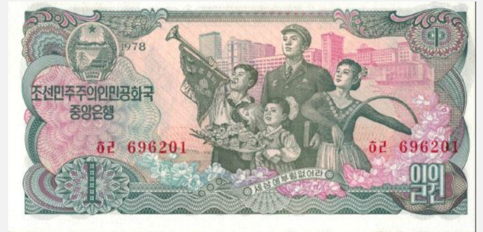
1 вона 1978 года

Корейская государственность ведёт свою историю от IV—III веков до н. э. По результатам Второй мировой войны Корея, прежде находившаяся под управлением Японской империи, была разделена на северную часть, перешедшую в ведение СССР, и южную, контролируемую США. Корейская Народно-Демократическая Республика была провозглашена на территории советской зоны оккупации 9 сентября 1948 года, после основания Республики Корея 15 августа в пределах американской зоны оккупации. Последующая за этим Корейская война (1950—1953) закрепила деление страны.