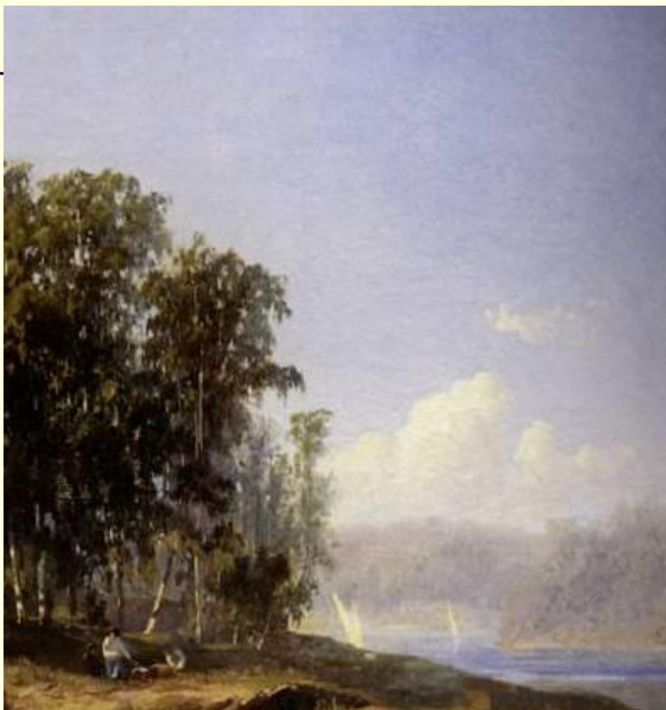
Сцена под СТОГОМ