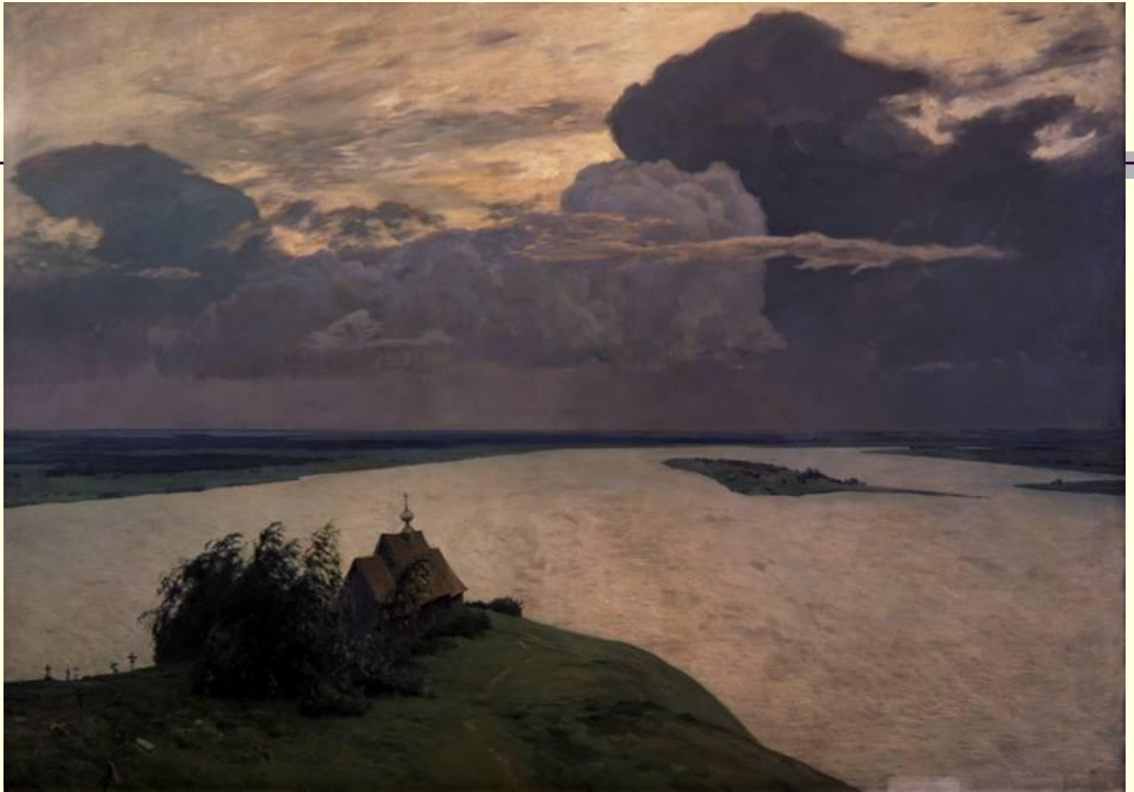
Левитан И. И. «Над вечным покоем»