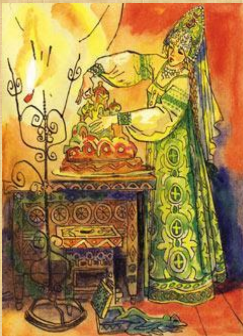
Царевна - Лягушка