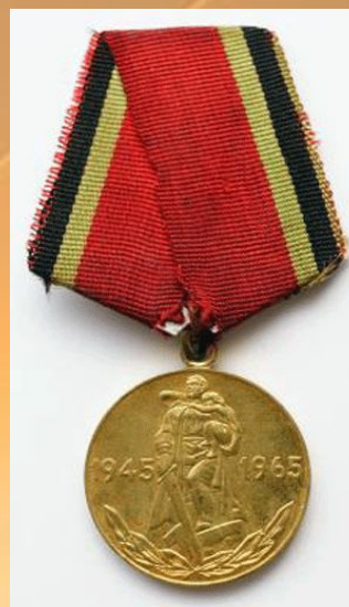
Юбилейная медаль 20 лет Победы в Великой Отечественной войне