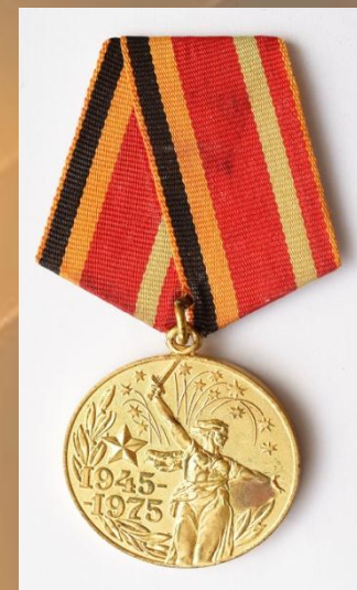
Юбилейная медаль 30 лет Победы в Великой Отечественной войне