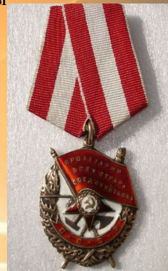
Орден Красного Знамени