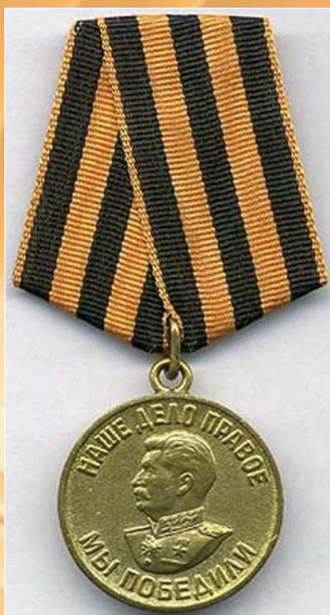
Медаль за Победу над Германией