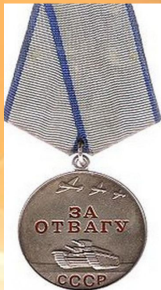
Медаль за Отвагу