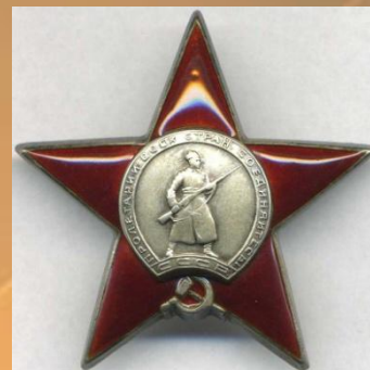
Орден Красной Звезды

За заслуги перед Отечеством награжден множеством наград: Орденом Отечественной Войны 1 степени, Орденом Красного Знамени, Орденом Красной Звезды, Медалью за Отвагу, Медалью за Победу над Германией, Юбилейными медалями к 20-летию и 30-летию Победы в Великой Отечественной войне и т.д.