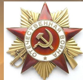
Орден Отечественной войны I степени