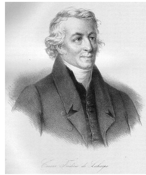
Вверху: Александр I Внизу: Екатерина II, Павел I, Фредерик Лагарп (учитель)