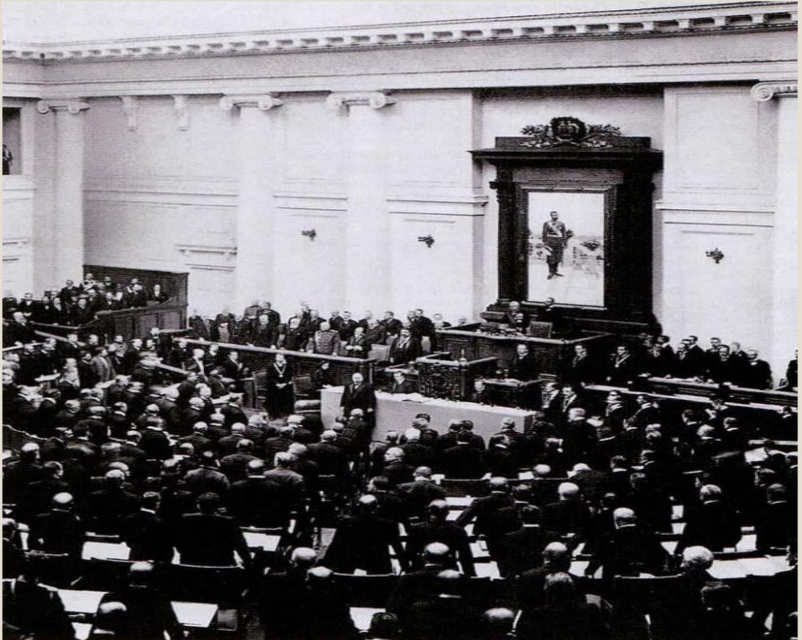
1 Государственная Дума