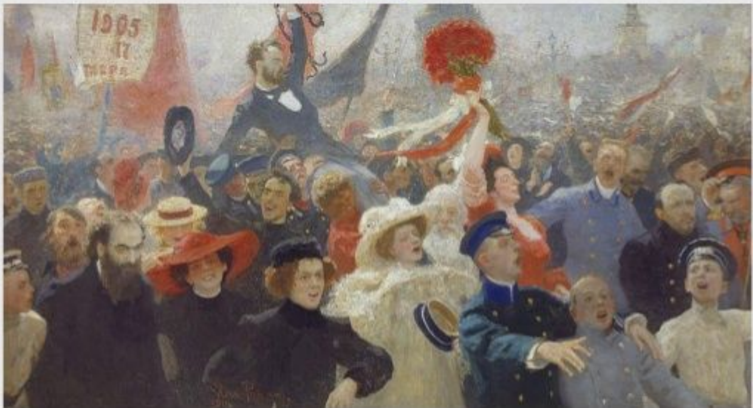
Илья Репин. 17 Октября 1905