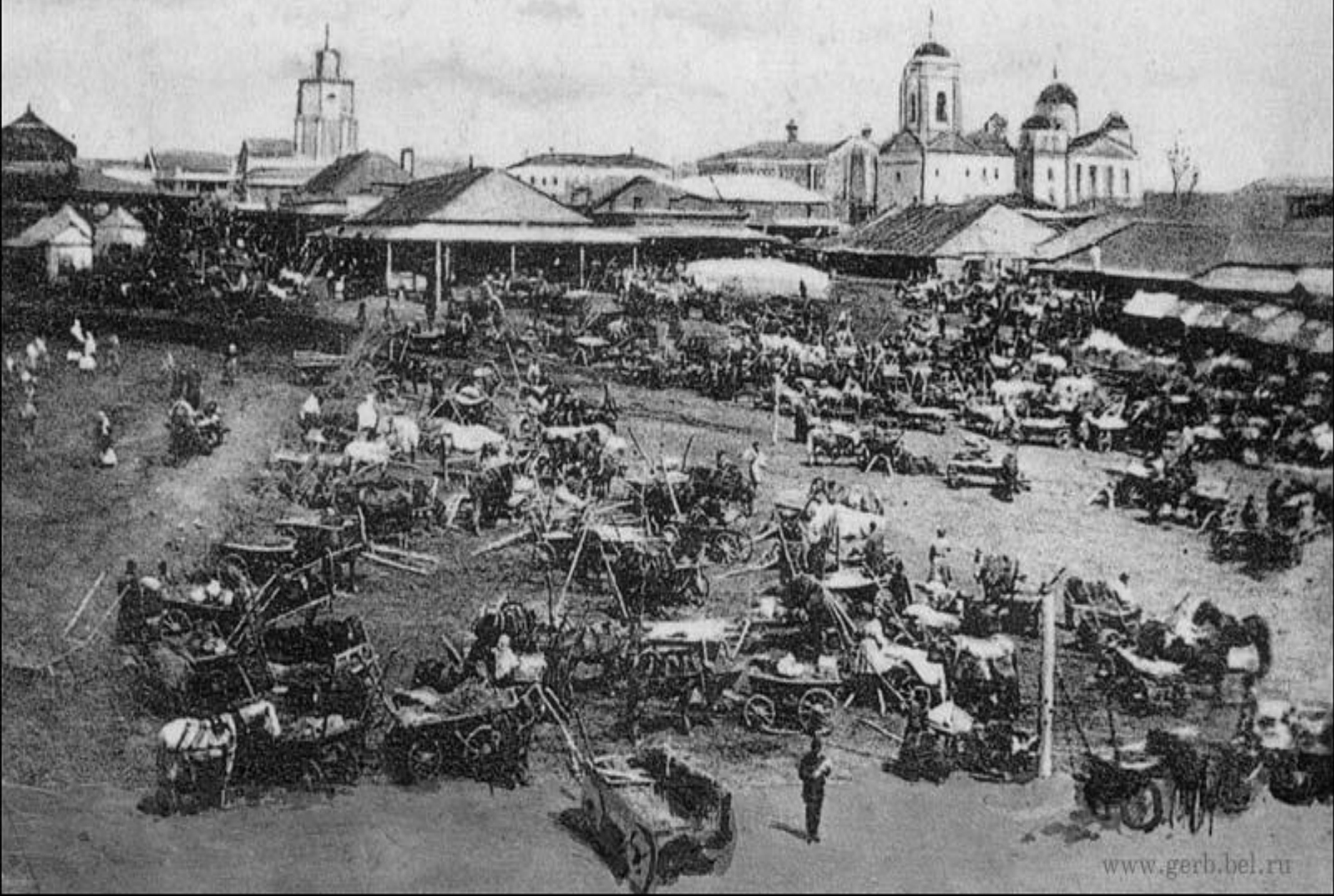
Бѣлгородъ. Базарная площадь.