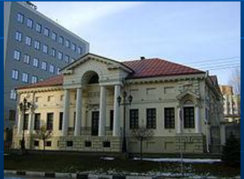
Бывшая старинная усадьба — литературный музей