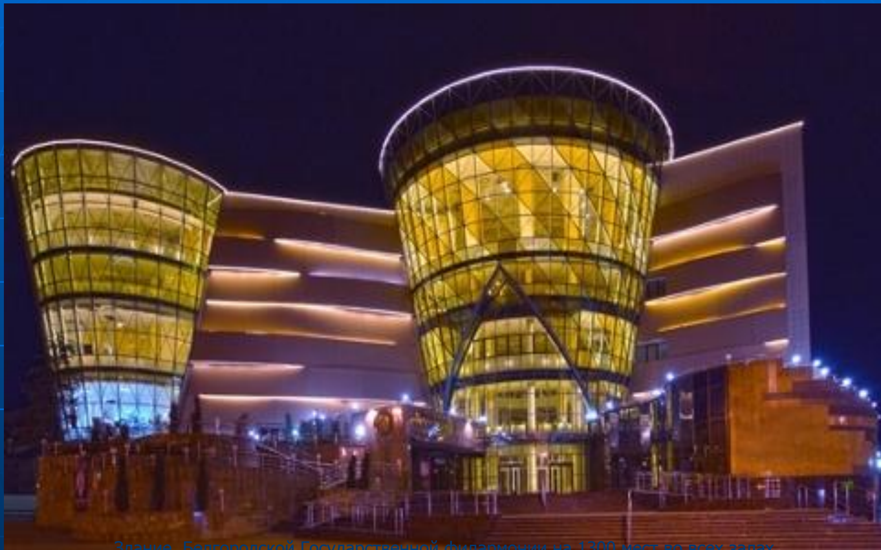
Здание Болшевской Патриаршей кафедральной филармонии на 1300 мест во время заеза.