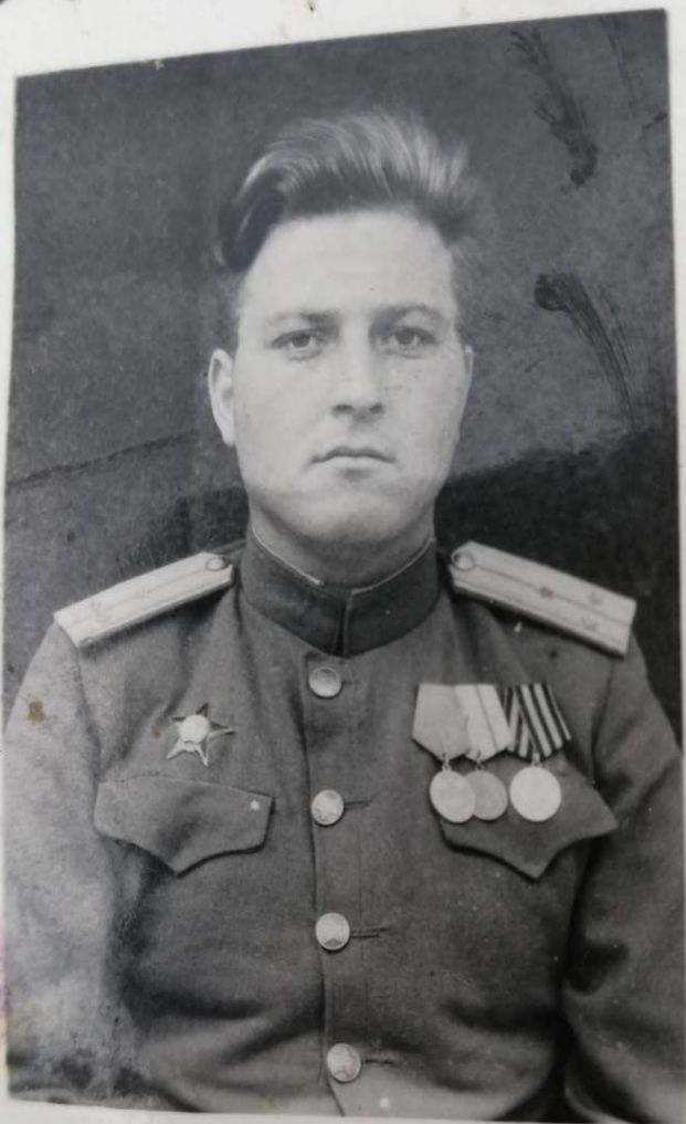
Участник Великой Отечественной войны