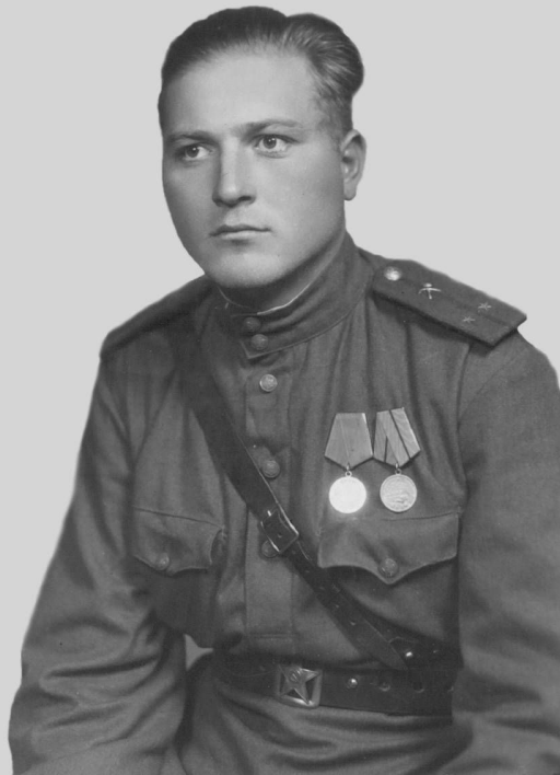
Участник Великой Отечественной войны