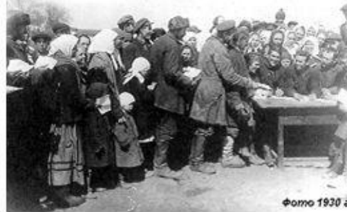
Крестьяне подают заявления о вступлении в колхоз.

осень 1929-32 - этап сплошной коллективизации - объединение в колхозы основной массы крестьян- единоличников;