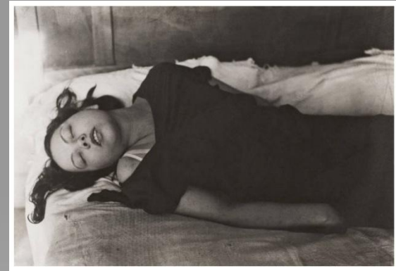
Брассаи «Сон» серия фотографий

Репортаж лучше снимать сериями. Серия может быть объединена или одним событием, раскрывающим его в развитии: в разные моменты и с разных точек, или одной темой.