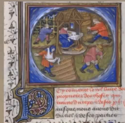
Труд крестьян - общинников. Миниатюра XV века

Порядок взаимного подчинения феодалов. Король являлся сюзереном для крупных феодалов, крупные - для средних, а те, в свою очередь - для мелких. При этом действовало правило "вассал моего вассала - не мой вассал"! Т.о., вассалы средних феодалов уже не имели никаких обязательств не только перед королём, но и перед крупными феодалами.