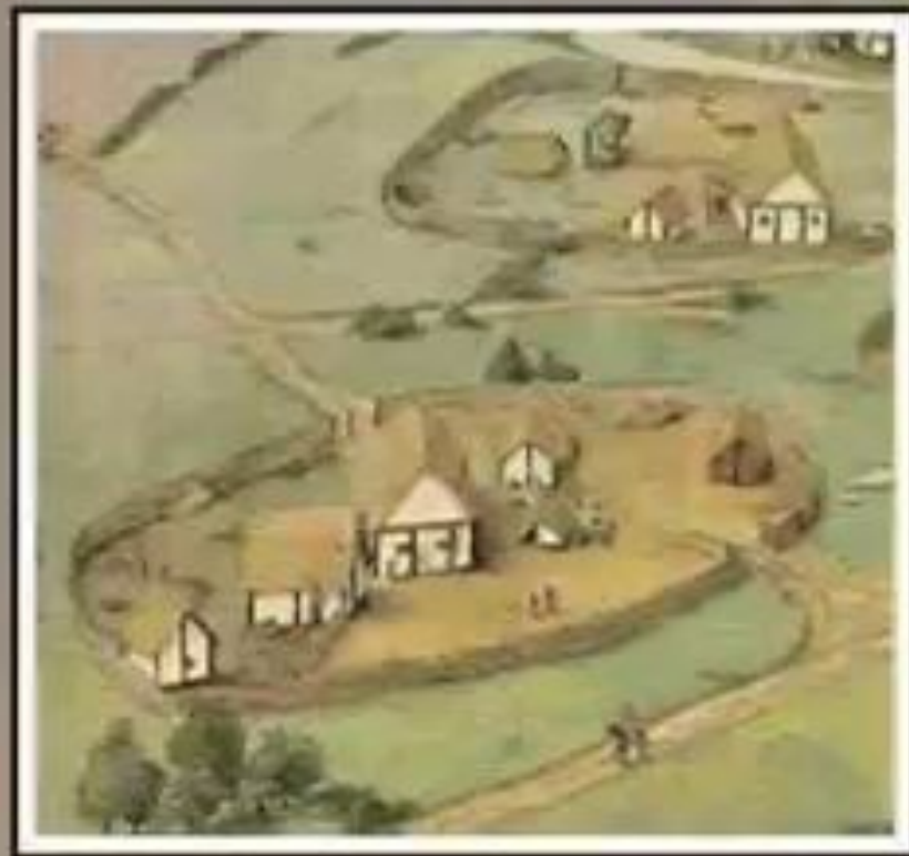
Средневековая деревня. Современная реконструкция