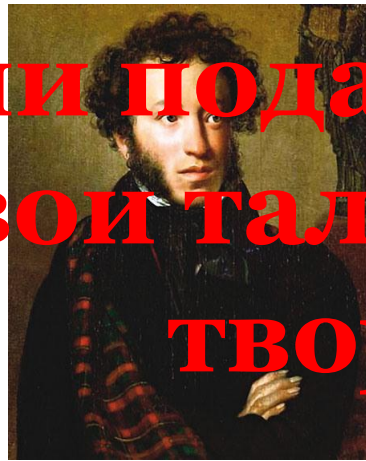
А.С.Пушкин - поэт