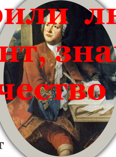
М.В.Ломоносов- первый русский учёный