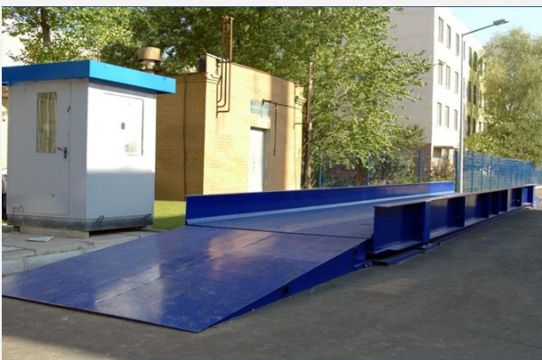
СУЦІЛЬНА МЕТАЛЕВА (ЦІЛІСНА ПЛАТФОРМА)