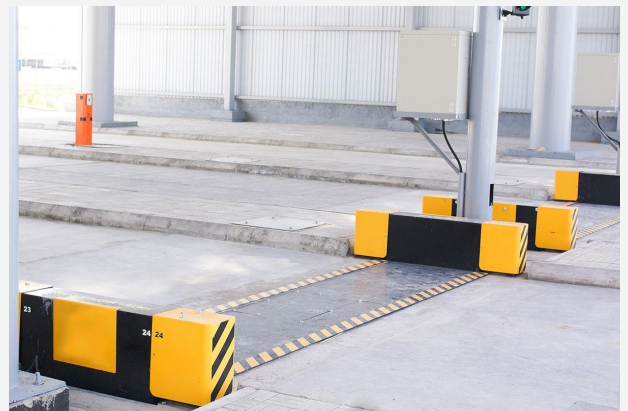
ДИНАМІЧНІ, ПООСНОГО ЗВАЖУВАННЯ