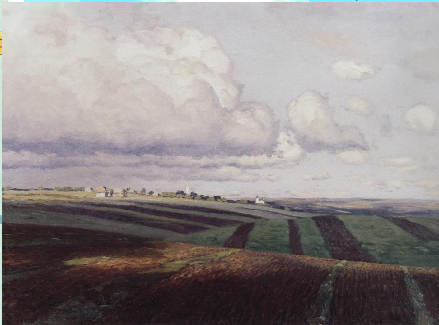
Дубовской Н.А. Родина. 1905 г.