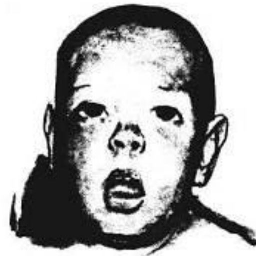
Рис. 4. Ребенок с синдромом Смит — Лемли — Опитца