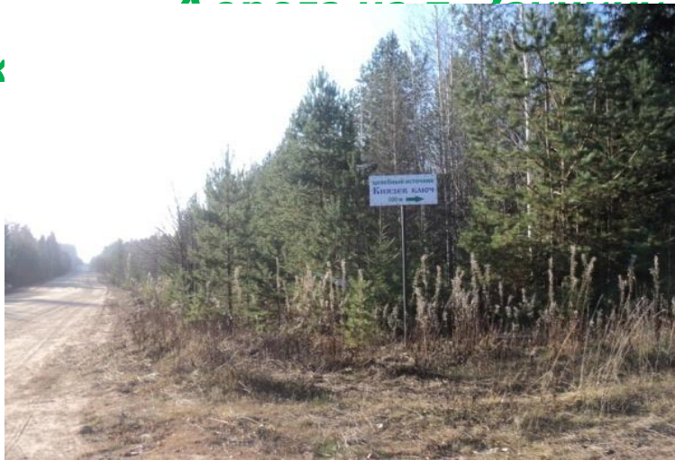
Дорога на п. Зайчики