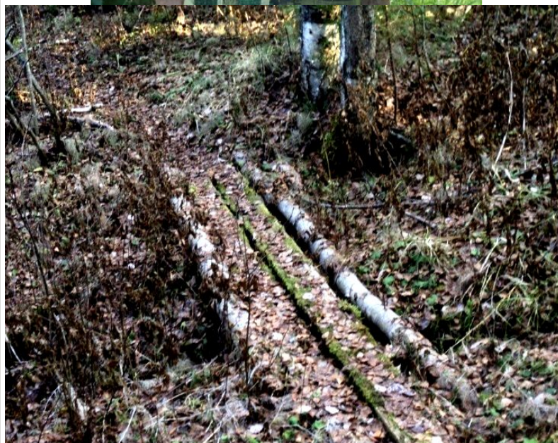
Речка Князевка, переходы

Дорога раньше проходила через нашу деревню Дресвяновово. За деревней шли полем, потом по лесным урочищам Чавково, Литомино, Бувдырь, Степаново, шли до речушки Князевки, это перед самым ключом. Ходило много людей, они бросали монетки, оставляли одежду, кто какую, смотря что у кого болит. Умывались и брали с собой воду. Зимой вода не замерзала.