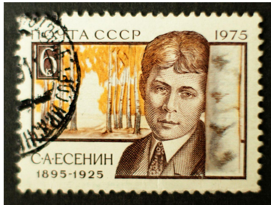
Поштова марка СРСР присвячена С. О. Єсеніну, 1975 (Каталог ЦФА 4505, Скотт 4369)

За іншою версією Сергія Єсеніна вбили за наказом вищих партійних чинів. Але не потрібно забувати про те, що Єсенін шукав втіху у алкоголі.