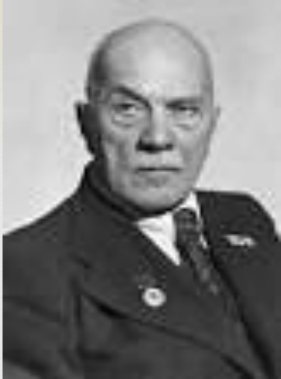
Алексей Викторович Щусев (1873-1949гг)

Известное произведение времен конструктивизма — работа архитектора Алексея Викторовича Щусева, мавзолей Ленина на Красной площади. Здание было возведено из железобетона, облицовано гранитом и лабрадоритом. Это постройка объединила в себе черты конструктивизма и ар-деко, сменившего и модерн, и конструктивизм.