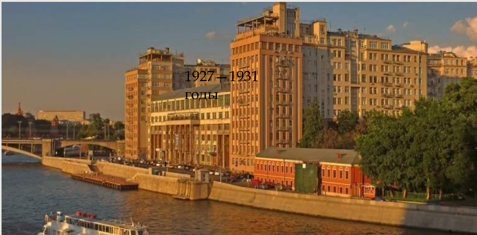
Дом на набережной. (1927-1931 гг). Архитектор Борис Михайлович Иофан.