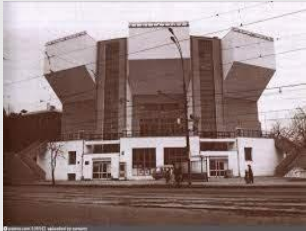
Мельников К.С. Клуб им. Русакова 1927г. - 1929г.