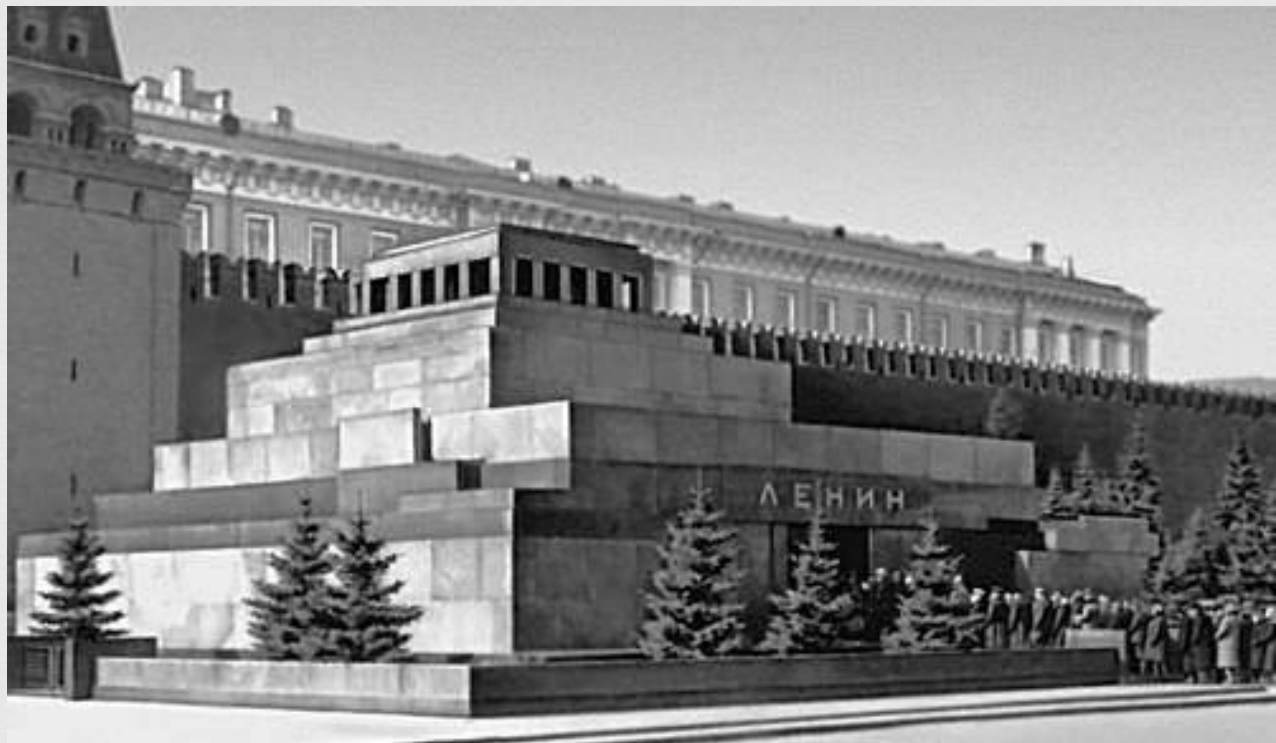
Мавзолей В. И. Ленина. Москва, Красная площадь. Габронорит, гранит,

Известное произведение времен конструктивизма — работа архитектора Алексея Викторовича Щусева, мавзолей Ленина на Красной площади. Здание было возведено из железобетона, облицовано гранитом и лабрадоритом. Это постройка объединила в себе черты конструктивизма и ар-деко, сменившего и модерн, и конструктивизм.