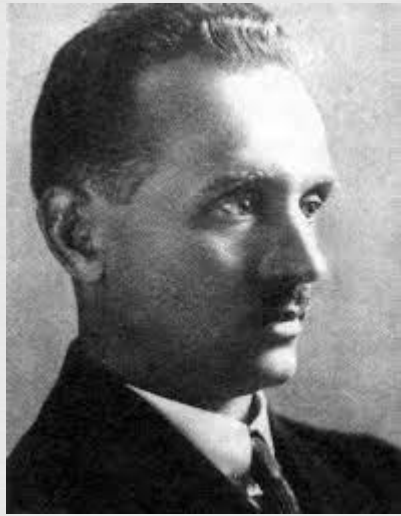
Мельников К.С (1890-1979 гг.)

В первые годы советской власти великие конструктивисты: Веснины, Константин Мельников, Иван Леонидов, Моисей Гинзбург, Георгий Гольц в аскетическом, но полном зажигательной утопической фантазии стиле строили фабрики, домакоммуны для коллективного быта, дома культуры, фабрики-кухни и прочее выдумки отчаянных революционных фантазеров.