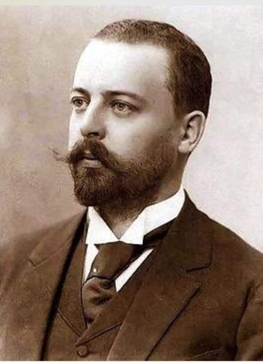
Федор Осипович Шехтель 1859 -1926 гг.

В России стиль модерн был представлен, в первую очередь, работами архитектора Федора Осиповича Шехтеля. Глобальный проект Шехтеля – здание Ярославского вокзала. Ярославская железная дорога связывала Москву с Белым морем и северными губерниями, поэтому Шехтель избрал для своего проекта новорусский стиль, преломленный, конечно, архитектором в индивидуальной манере. В 1901 году Шехтель проектировал павильоны для международной выставки в Глазго, где он впервые занялся переработкой древнерусских мотивов в архитектуре. В проекте вокзала сложные архитектурные решения совмещены с необыкновенной простотой, вокзал напоминает северные погосты-тройники. Декоративная лепнина, керамические панно, выполненные в абрамцевской мастерской – всё это отражает гениальный замысел Шехтеля.