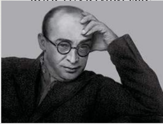
Моисей Гинзбург, фото 1920-х годов

Моисей Яковлевич Гинзбург (23 мая (4 июня) 1892, Минск — 7 января 1946, Москва) — советский архитектор, практик, теоретик и один из лидеров конструктивизма.