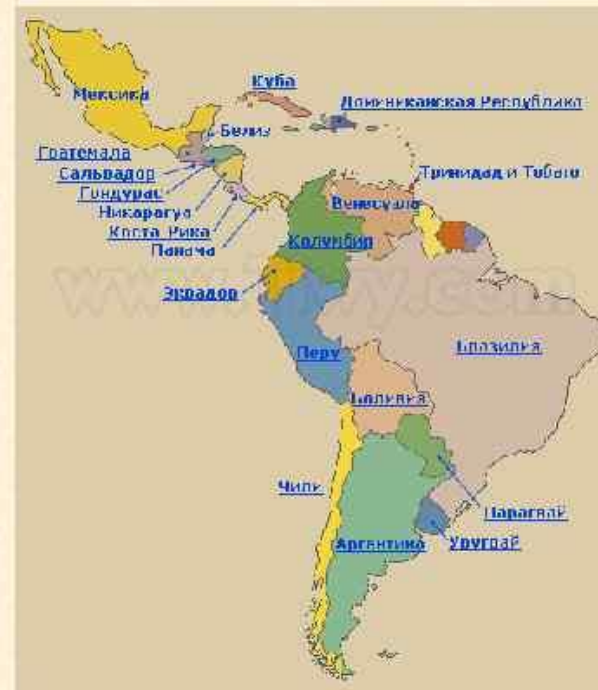
Карта Латинской Америки