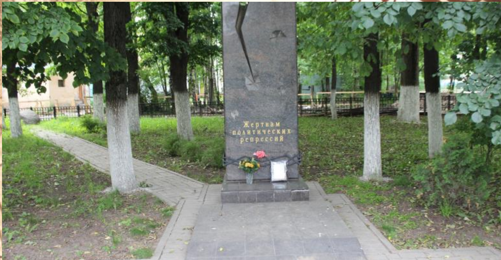
Памятник жертвам репрессий в центре Вологды