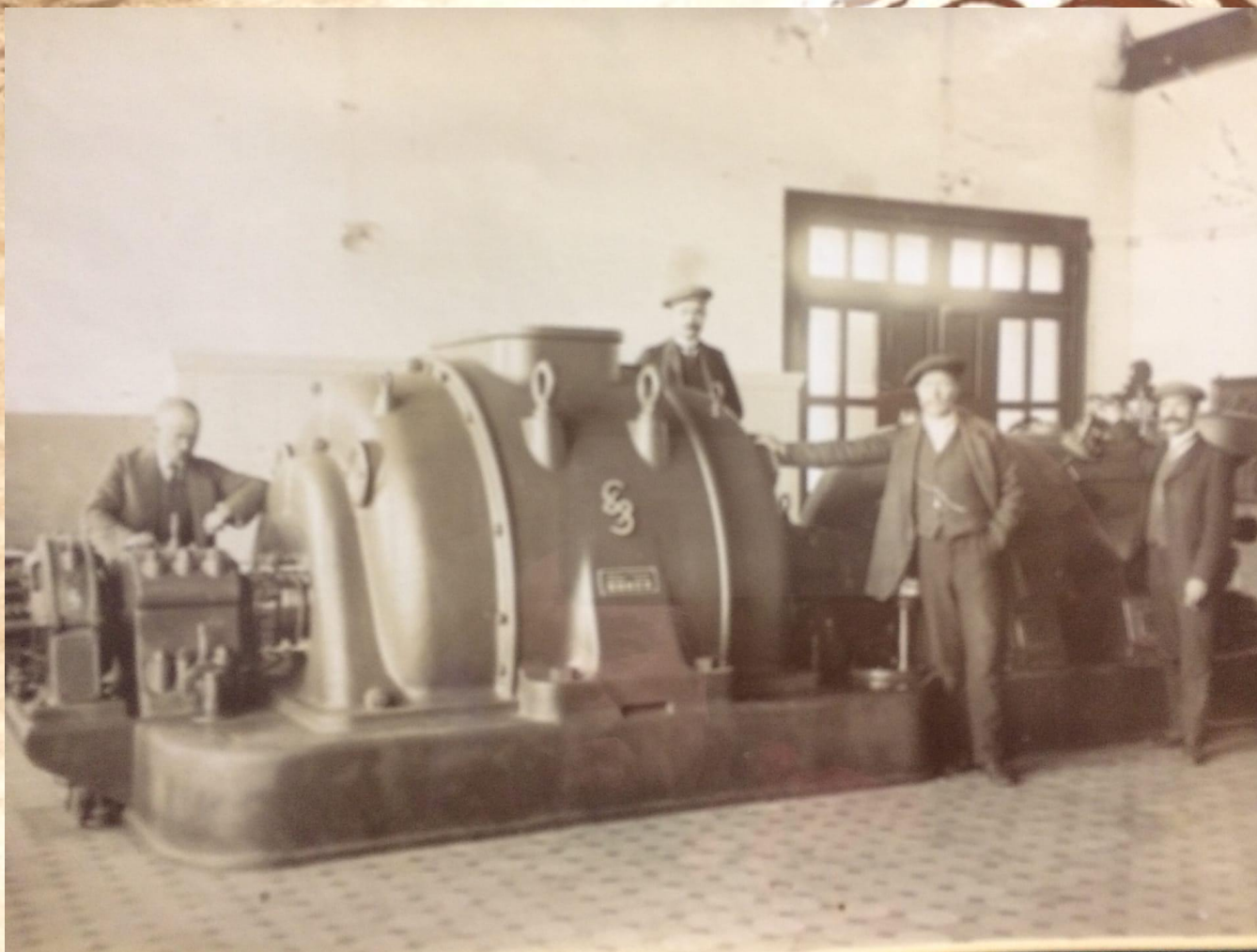
Предположительно фото электростанции в Морино