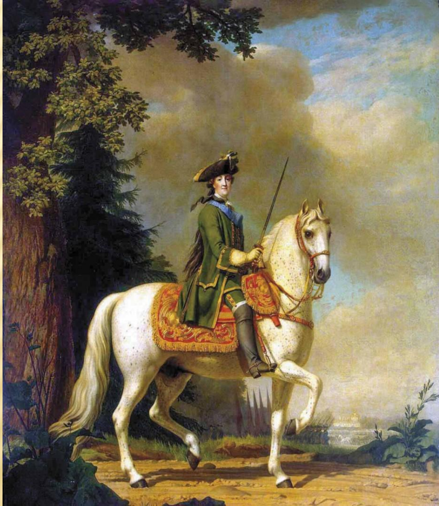
«Екатерина II верхом». Художник Вигилиус Эриксен

В галантном XVIII столетии мужские и женские наряды были одинаково рафинированными, причудливыми и замысловатыми. Придворные красавцы носили одежды из той же розовой или жемчужно-серой ткани, что и дамы. Пудренные парики, мушки, помады и притирания, пышные кружева, прихотливые вышивки и лёгкие туфельки с драгоценными пряжками - всё это было принадлежностью как мужской, так и женской моды.