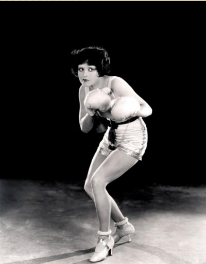
Кинозвезда 1920-х годов Клара Боу

В 1920-х годах маскулинизация женщин усилилась: девушки коротко подстриглись, стали курить, освоили мотоциклетные шлемы и приняли развязную манеру поведения.