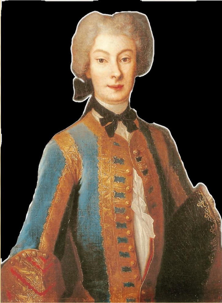
Портрет Анны-Каролины Орзельской. Художник Луи де Сильвестр

В «прекрасную эпоху» на рубеже XIX и XX столетий женщины стремились стать вровень с мужчинами.