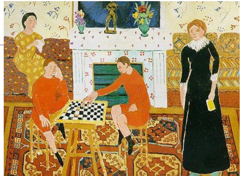
Семейный портрет 1914