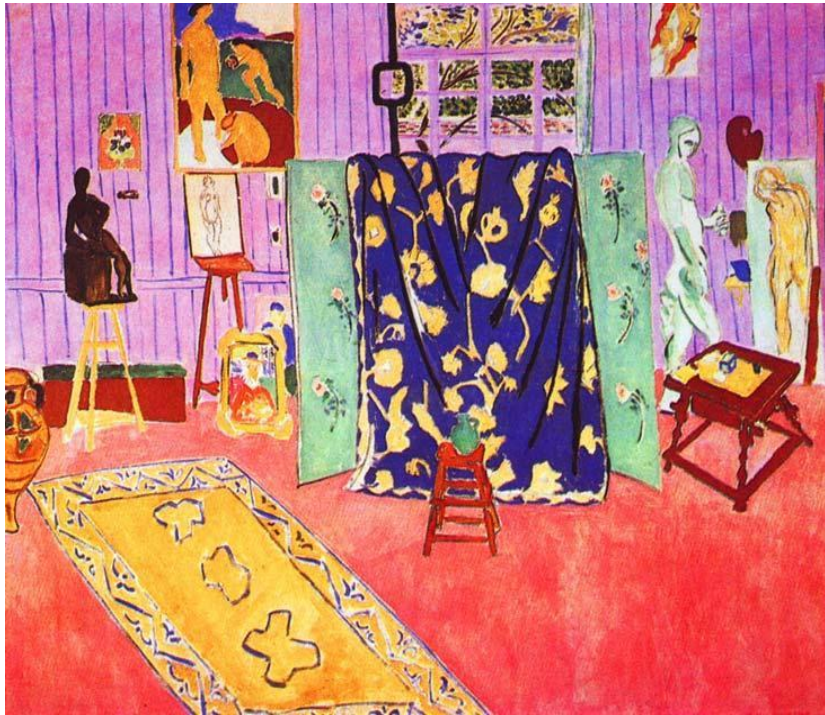
Мастерская художника 1911