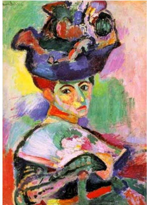
Женщина в шляпе 1905

Поиски непосредственной передачи ощущений при помощи интенсивного цвета, упрощенного рисунка и плоскостного изображения отразились в произведениях, представленных им на выставке «диких» (фовистов) на Осеннем Салоне 1905. В Салоне он выставляет ряд работ, и среди них «Женщину в зеленой шляпе». Произведения эти, произведшие скандальный фурор, положили начало фовизму.