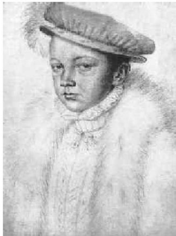
Ф. Клуэ. Франциск II.