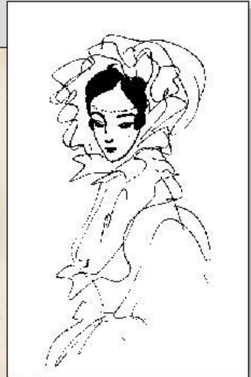
Надя Рушева. Портрет Н. Пушкиной. Тушь, перо