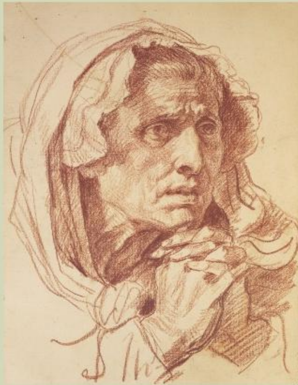
Жан Батист Грёз

Среди цветных графических рисунков художники очень любят сангину. Её красивый красновато – коричневый цвет придаёт рисунку чудесный живописный оттенок.