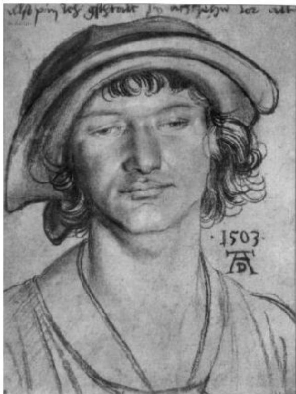
А. Дюрер. Портрет восемнадцатилетнего молодого человека.

Особенности графики позволяют художнику проявить особую чуткость в понимании человека. Условность и лаконичность графического языка дают возможность выявить самое главное, ярко характерное.