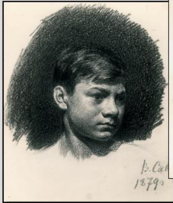
В. Е. Савинский. Портрет мальчика. 1879. Бум., ит. кар.

Основными выразительными средствами графики являются линия , штрих и пятно