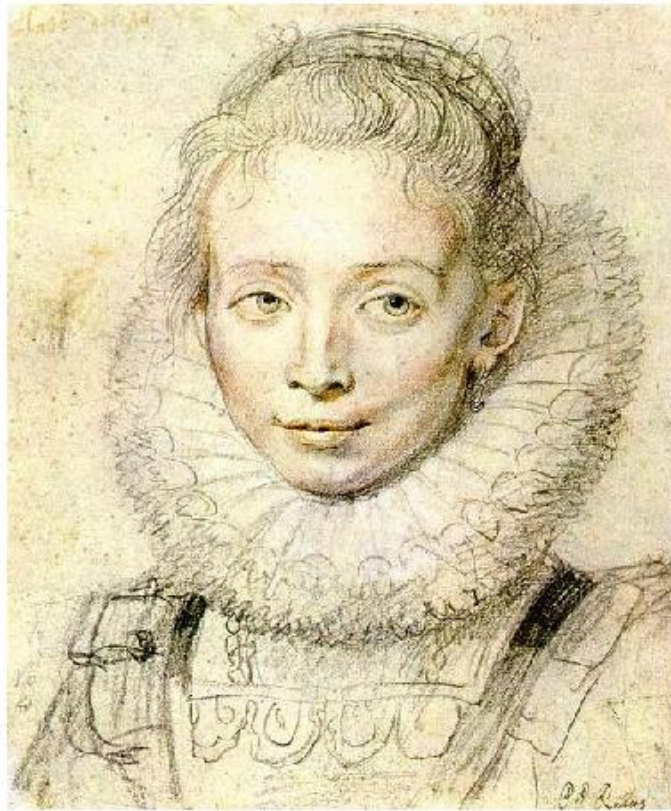
П.П.Рубенс. Портрет Инфанты Изабеллы.

Замечательные графические образы созданы художниками разных времён. Они показывают нам неисчерпаемость выразительных возможностей графики и неистощимое богатство индивидуальности человека, неповторимость каждого момента жизни.