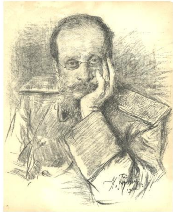
И. Е. Репин. Портрет Ц.А. Кюи.