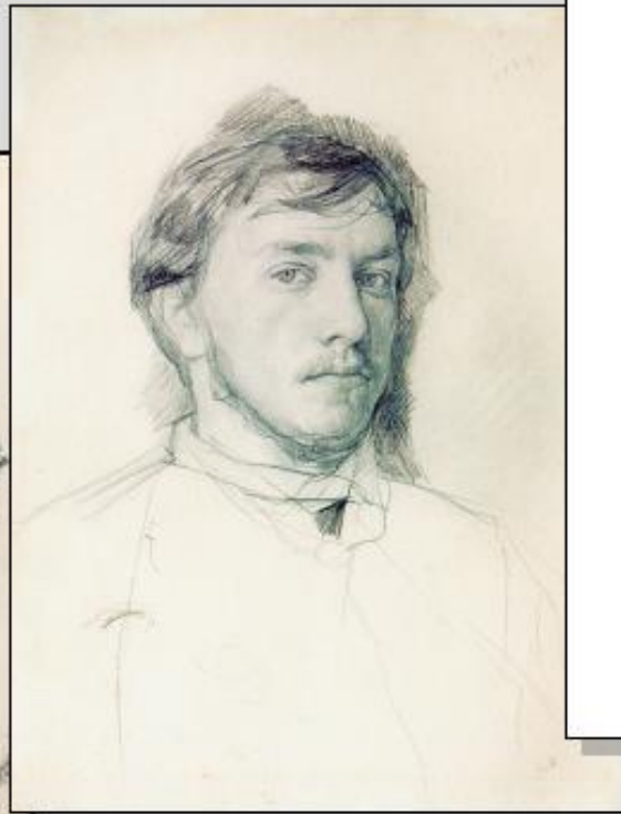
В. А. Серов. Автопортрет. 1885. Бум., граф. кар.