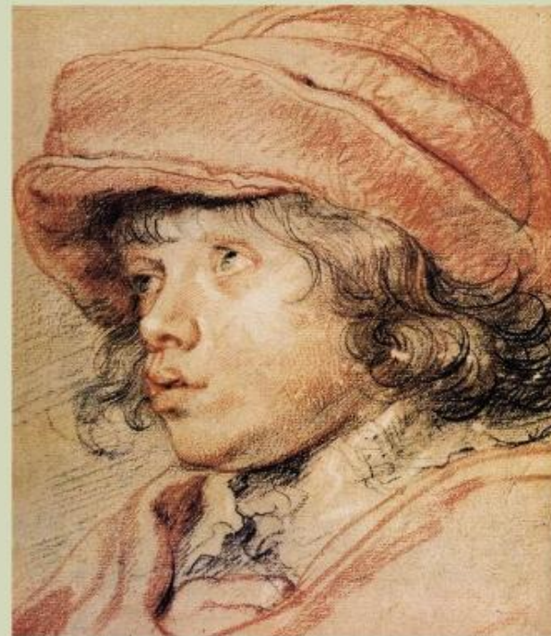
Рубенс Портрет Альберта, сына художника