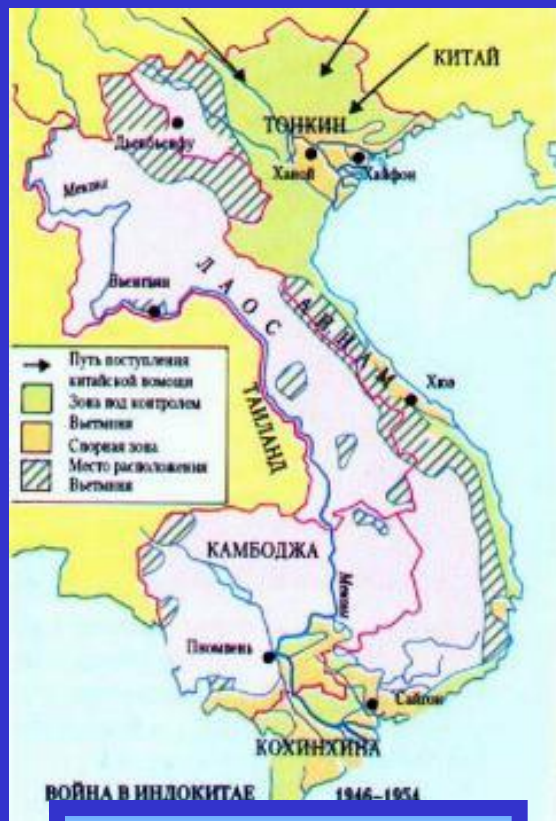
Война в Индокитае