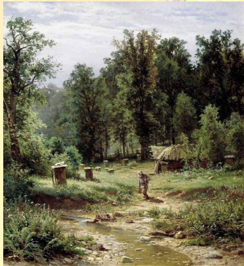
Пасека в лесу. 1876 г.