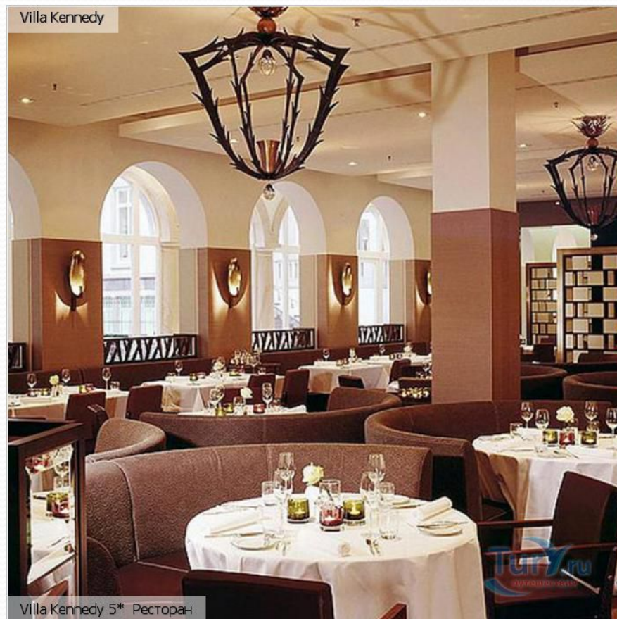
Villa Kennedy 5* Ресторан