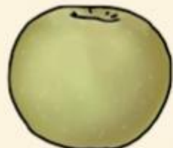
Ренет семиренко пряные с кислинкой