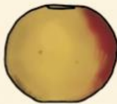
Фузи сладкие, но вкус не выражен