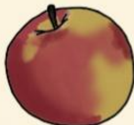
Джанагола сочные, ароматные, сладко-винный вкус