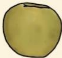
Гренни Смит кислые, не сладкие, низкокалорийные