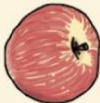
Гала душистые и сладкие