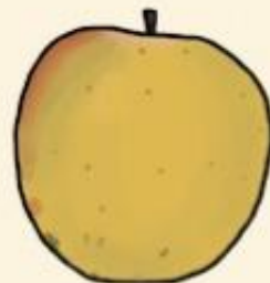
Голден сладкие без кислинки, хороши для пастилы, мармелада