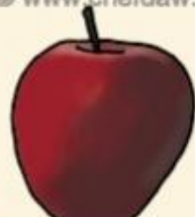
Ред делишес сладкие с легкой горчинкой