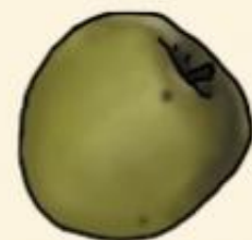
Антоновка насыщенный аромат