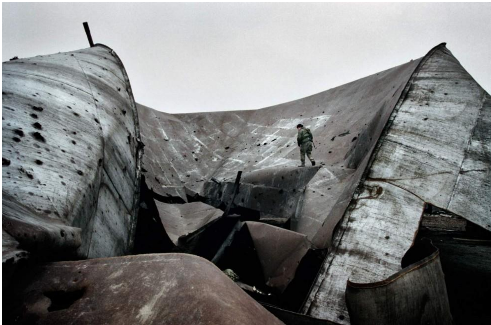
Российский солдат возле нефтеперерабатывающего завода, разрушенного ещё во время Первой чеченской войны, в селе Центарой, декабрь 1999 года.