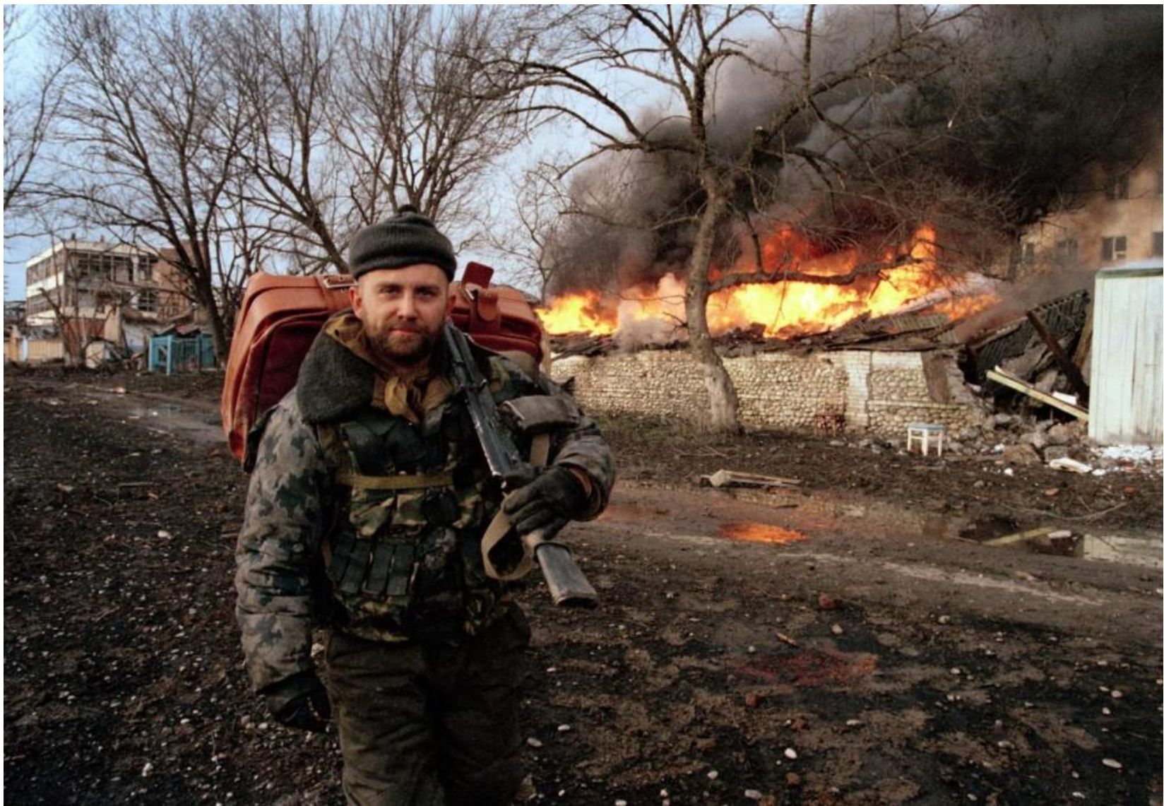
Российский военный в Грозном, январь 2000 года.