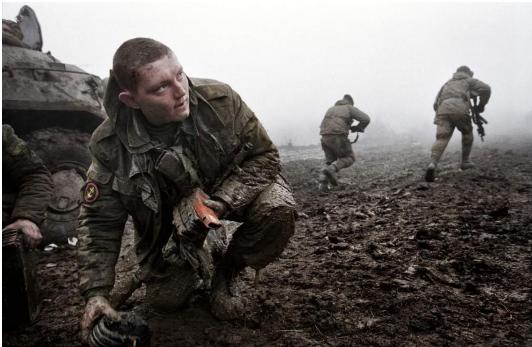
Российские морские пехотинцы отражают нападение чеченских боевиков возле села Центарой, декабрь 1999 года.