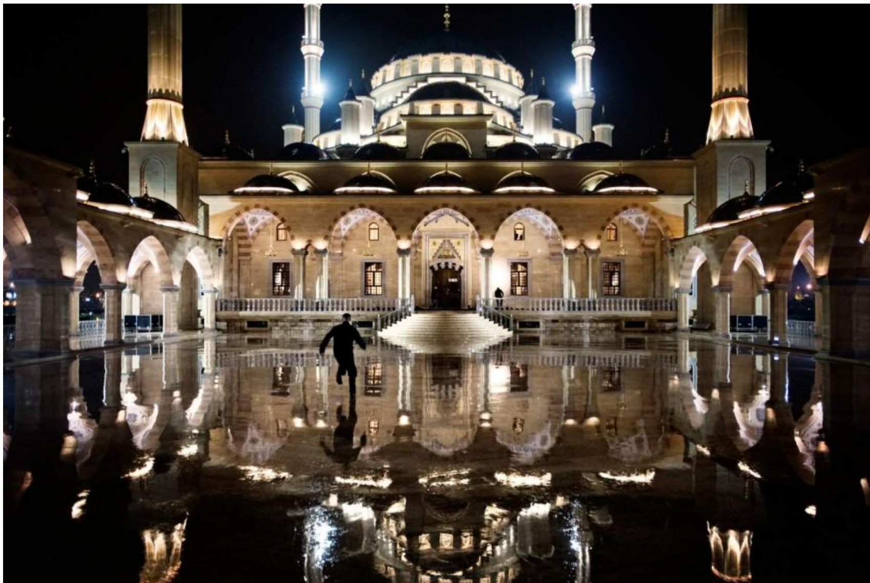
Одна из крупнейших мечетей на территории Европы «Сердце Чечни» была построена в Грозном в память об Ахмате Кадырове, отце Рамзана Кадырова. Октябрь 2009 года.