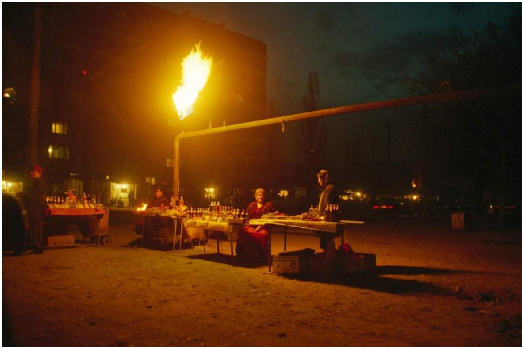
Женщины торгуют на улице в Грозном, февраль 2002 года.