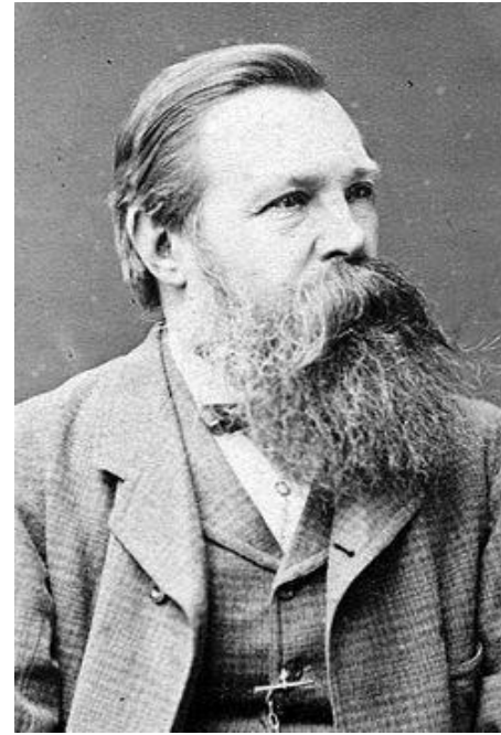
Фридрих Энгельс ( 28 ноября 1820 года, Бармен — 5 августа 1895 года, Лондон )