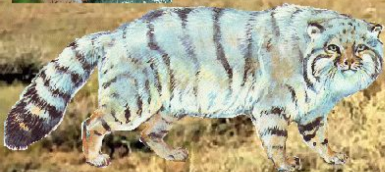
манул – дикий кот