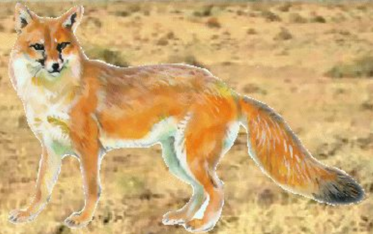
корсак – степная лисица