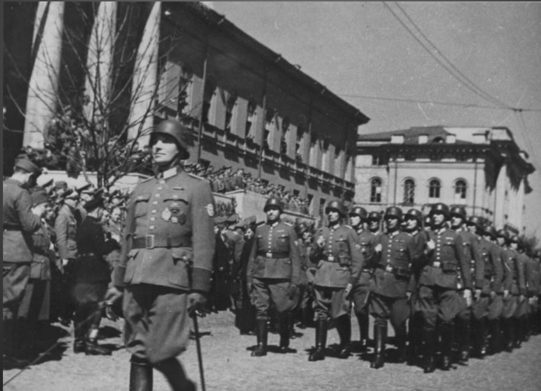
Киев в оккупации.

9 сентября немецкие войска подошли к Киеву и окружили его. Уже 19 сентября немецким войскам удалось войти в город, а киевская группировка советских войск вынуждена была отступить.