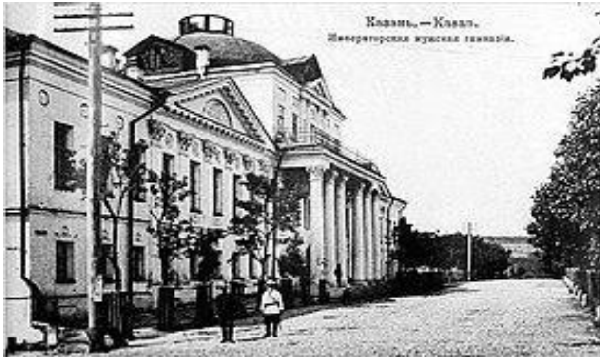
Первая Казанская мужская