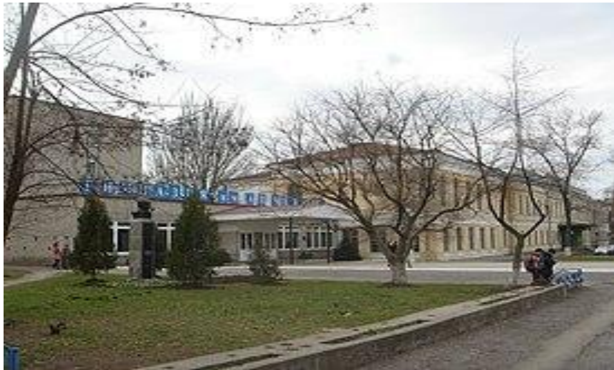
Константи́н Аполло́нович Сави́цкий 1831-1892