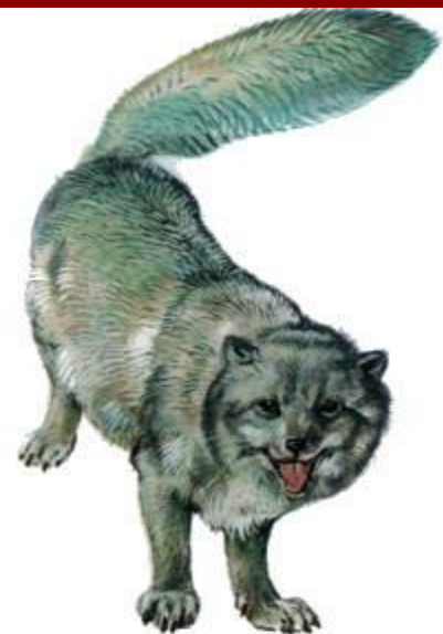
Песец (до 75 см)

Постоянно живут в тундре: лемминги, песцы, северные олени.