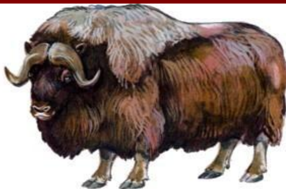
Овцебык (до 2,45 м)