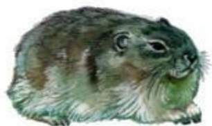
Копытный лемминг (до 14 см)