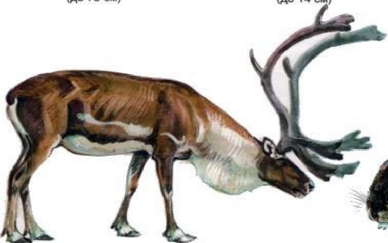
Северный олень (до 2,2 м)