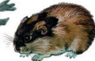
Норвежский лемминг (до 15 см)