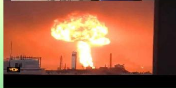
ЯПОНСКАЯ АЭС «ФУКУСИМА 1»-2011 г.