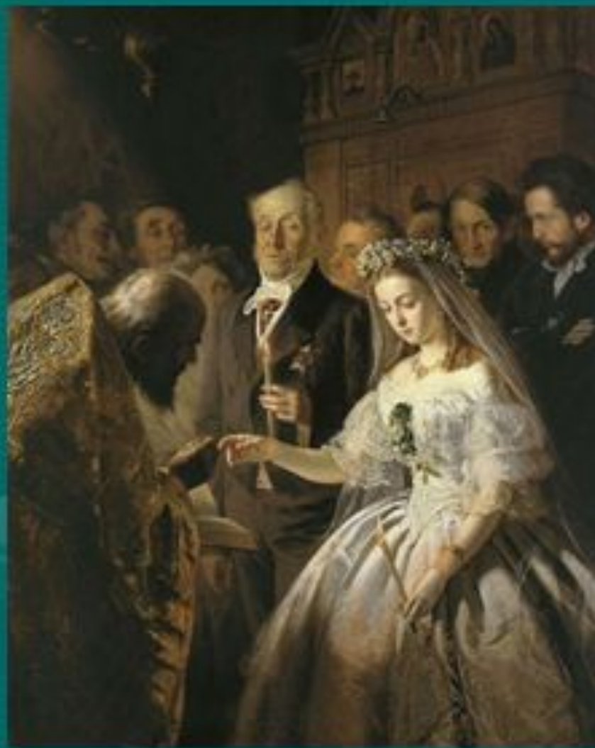
«Неравный брак» Пукирев В.В.

своей грустью, печалью и вызвать у нас чувство ..... ?