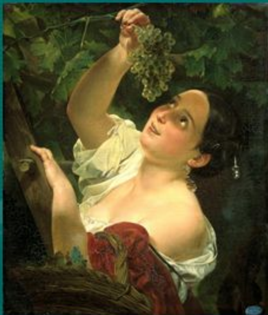
БРЮЛЛОВ К.И. «Итальянский полдень»

А также умением видеть красоту и научить нас восторгаться ею