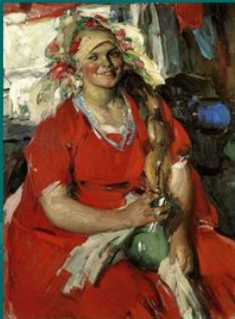
«Женщина в красном» Архипов А. Е.

умением замечать радость вокруг себя и радоваться самому простому