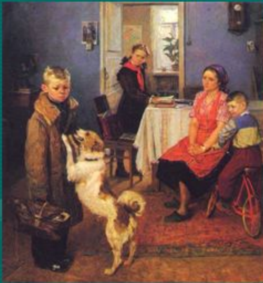
Решетников Ф.П. «Опять двойка»

отношением к проявлениям окружающей нас жизни и вызвать у нас чувство ....?