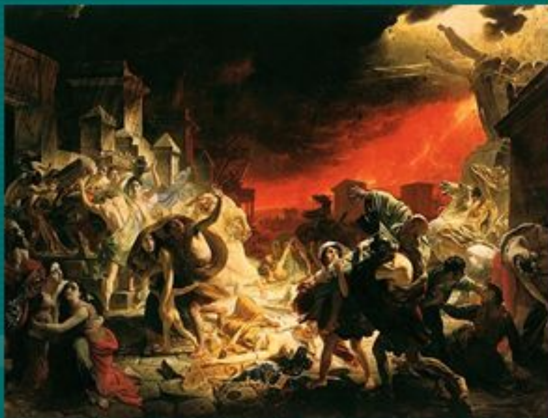
БРЮЛЛОВ Карл «Последний день Помпеи»

отношением к самым разным событиям и вызвать у нас сострадание к чужому горю