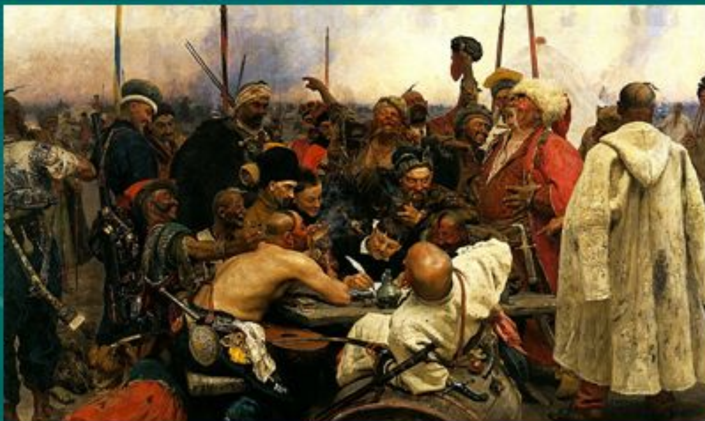
РЕПИН И.Е. « Запорожцы»

сопоставить страшное и веселое – трагическое и комическое, чтобы мы осознали.....?