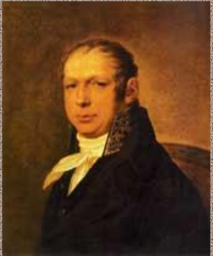
Арх. А.Д. Захаров

В 1806—1823 годах перестройка здания велась под руководством знаменитого архитектора А.Д. Захарова. Комплекс был полностью перестроен. Здание стало трехэтажным, украшенное 56 статуями, 11 барельефами и 350 лепными украшениями. Идея архитектора состояла в прославлении могущества Русского флота, укреплении образа России как морской державы.