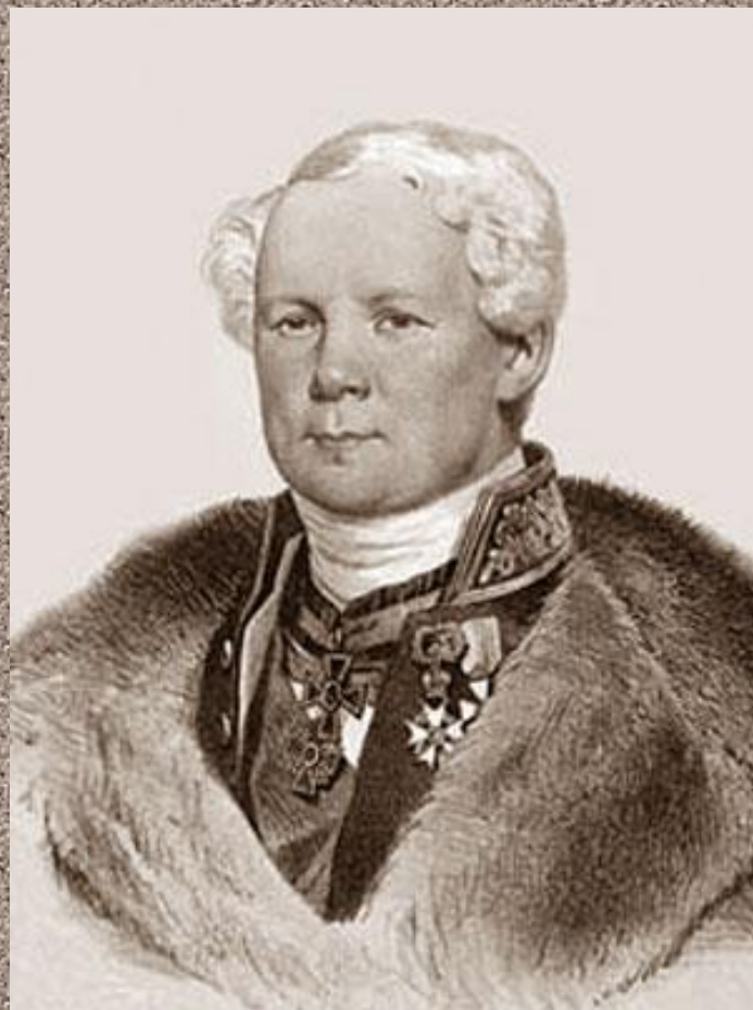
Архитектор О. Монферран