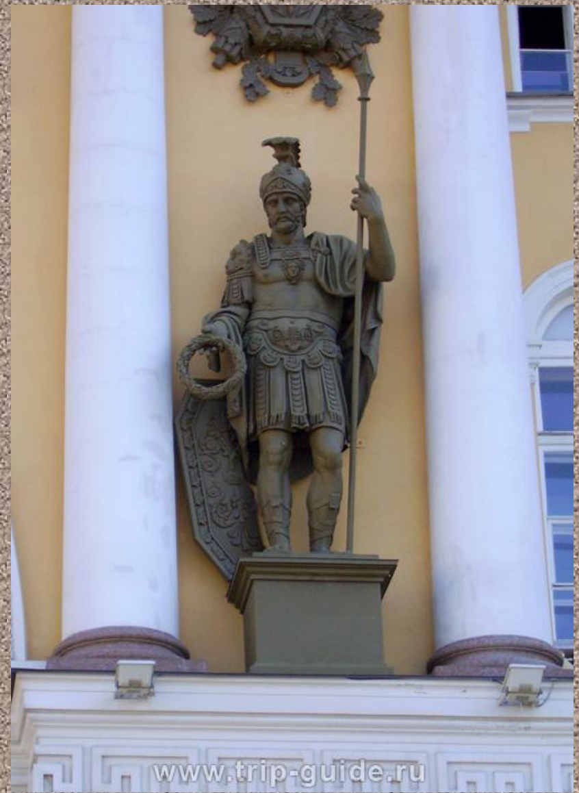
Фигуры воинов. Скульпторы С.С.Пименов и В.И.Демут-Малиновский