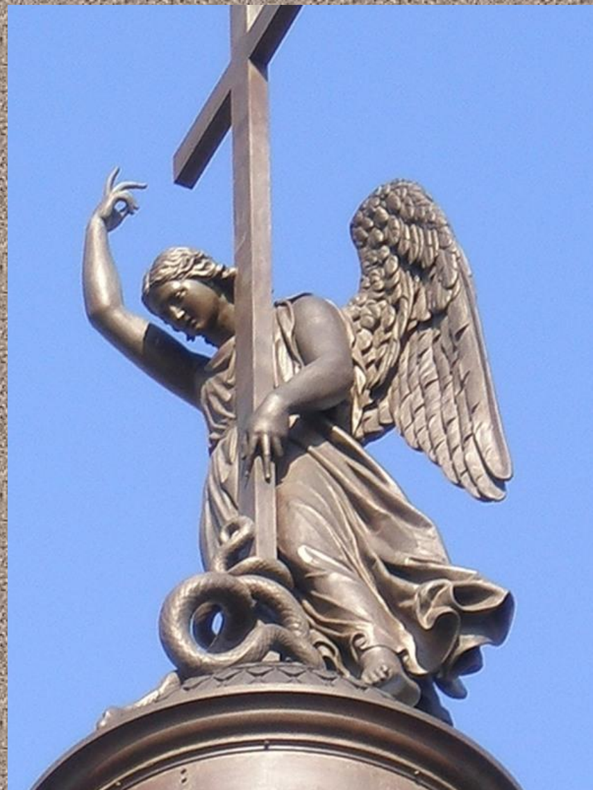
Фигуру ангела выполнил Скульптор Б.И.Орловский