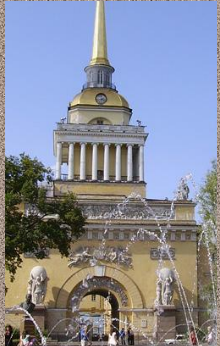
Скульптурное убранство Адмиралтейства