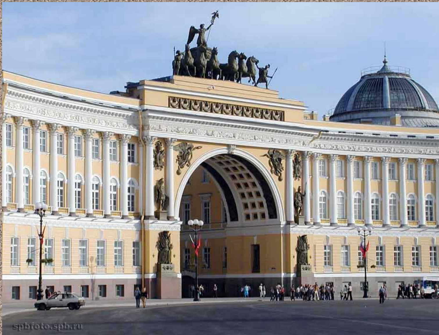
Арка Главного штаба